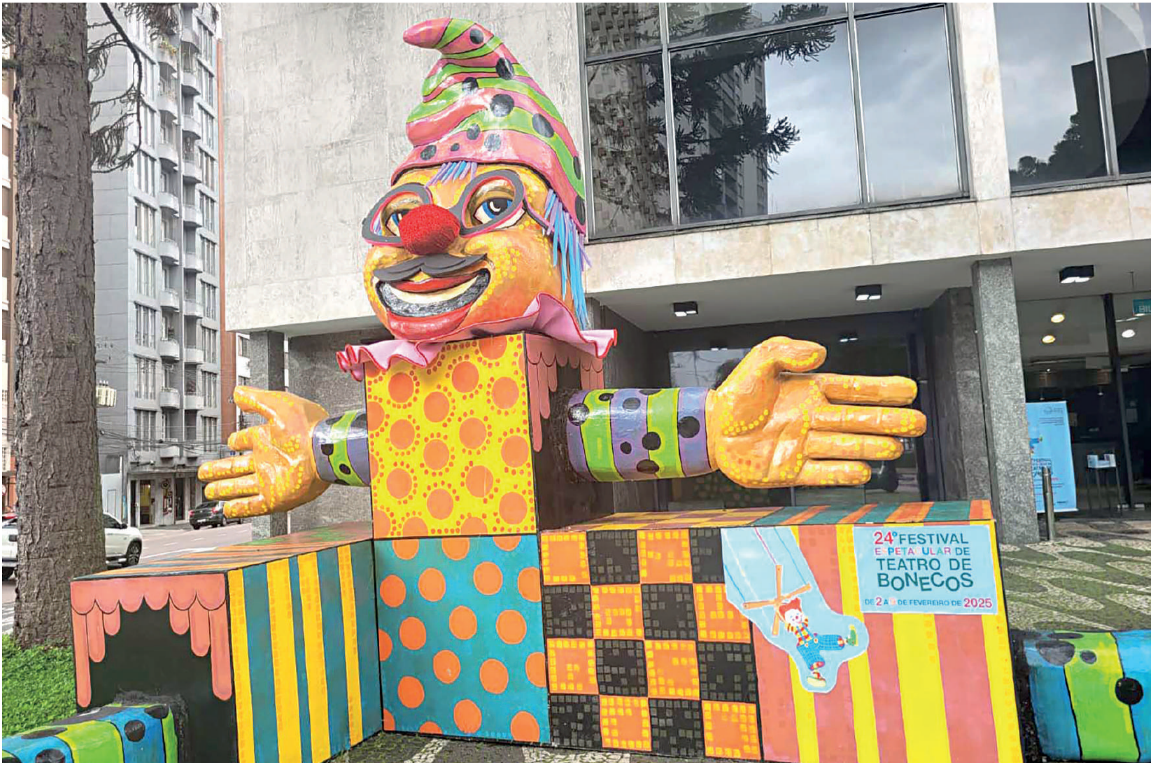
Agenda contemplou diferentes linguagens do teatro de bonecos