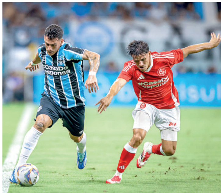
O Grêmio empatou com o Inter no Gre-Nal Lucas Uebel

O técnico Gustavo Quinteros reconheceu e citou os problemas que o Grêmio teve no Gre-Nal. Apesar disso, considerou uma "partida positiva" de seus comandados. "Enfrentamos uma equipe forte, que ficou em quinto no Brasileiro, está na segunda temporada trabalhando junta. Saímos com um jovem improvisado de lateral-esquerdo, outro entrou em seu lugar improvisado. Com um extremo improvisado como Edenilson... Estamos jogando contra equipes bem armadas e sem todos os jogadores,