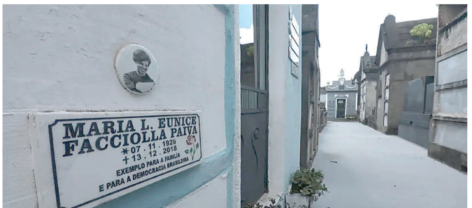
Túmulo de Eunice Paiva virou ponto turístico.

O drama brasileiro Ainda Estou Aqui é baseado no livro autobiográfico de Marcelo Rubens Paiva, que conta a história de sua mãe, a