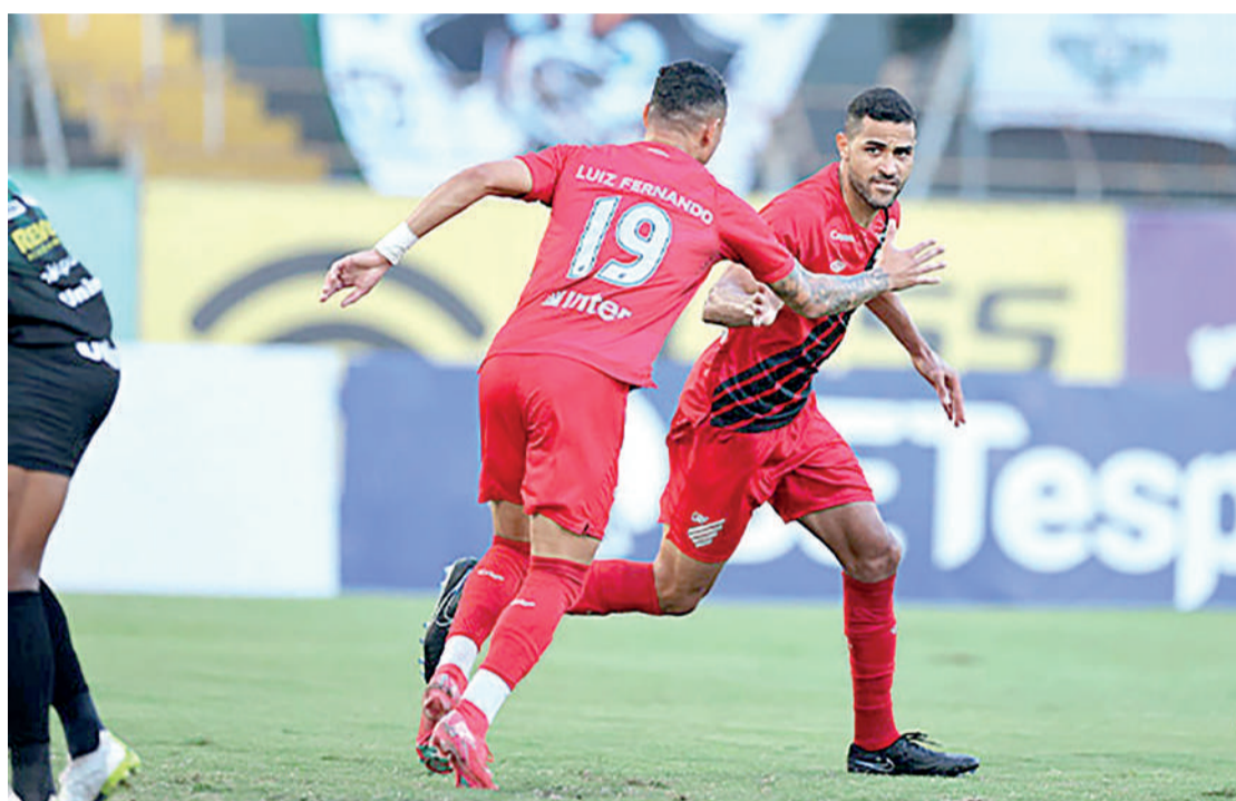
O Furacão é o líder do campeonato Site Athletico

Serpente Aurinegra, o Operário também garantiu a vaga antecipada nas quartas. O Fantasma tem os mesmos 18 pontos do Furacão. Ambos têm as mesmas campanhas. Em nove jogos foram cinco vitórias, três empates e apenas uma derrota. O que torna o Furacão líder é o número de gols marcados. A equipe chegou a 18 gols e é dona do melhor ataque da competição. São quatro a mais que o Fantasma, que tem a melhor defesa do Estadual com cinco gols sofridos. O Operário abre a penúltima rodada nesta terça-feira (11) e visita o Coritiba, às 20 horas no Couto Pereira.