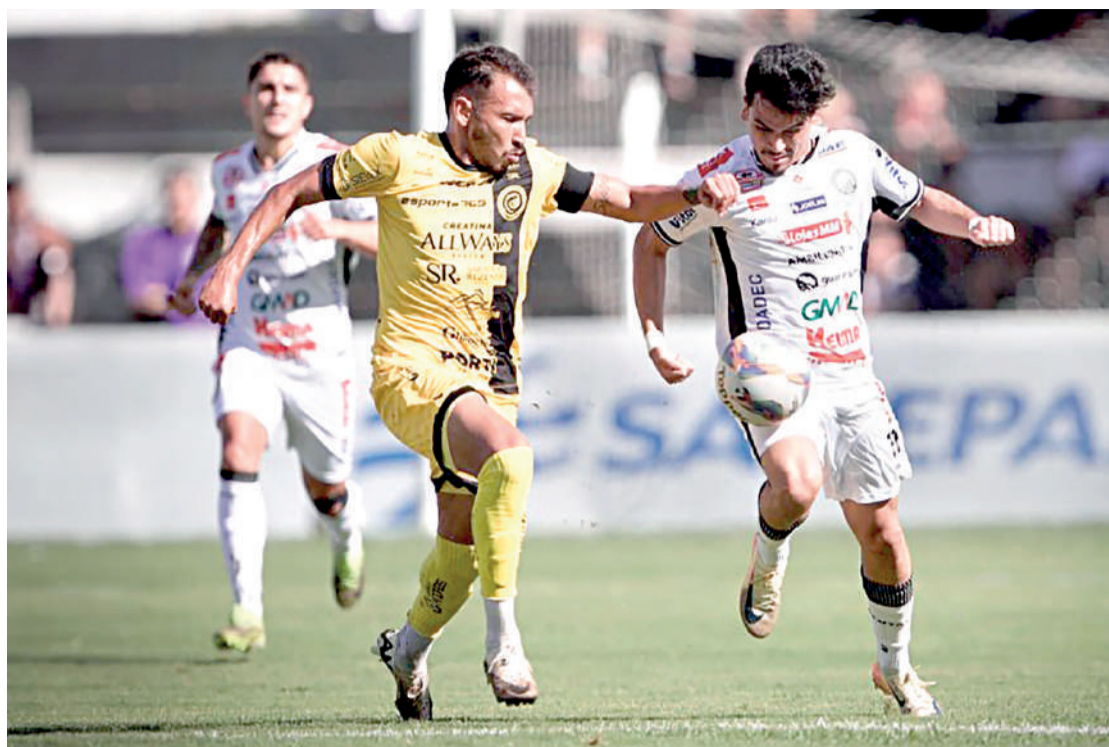
O Operário, que derrotou o Cascavel, enfrenta o Coritiba hoje André Jonsson