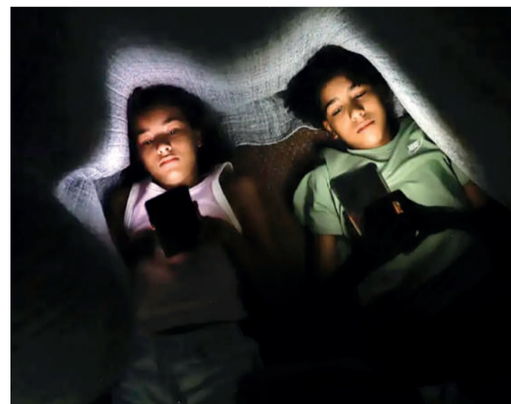
A pesquisa foi realizada com responsáveis por crianças Joédson Alves

O levantamento revela, por exemplo, que 89% dos pais e