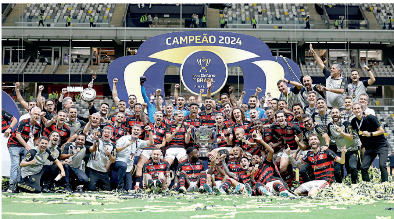
O Flamengo venceu a Copa do Brasil

sendo uma por 2 a 0 no Maracanã, e outra em uma goleada por 4 a 1 no Engenheiro. Nos últimos 10 jogos, são seis vitórias do Flamengo e quatro do Botafogo.