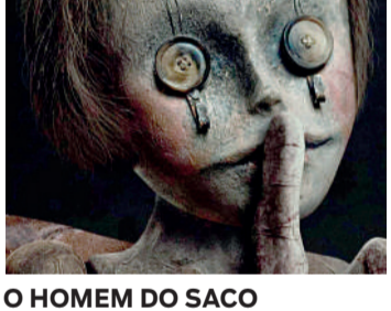
O HOMEM DO SACO Terror, 14 anos, Duração: 92 minutos