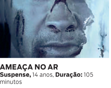
AMEAÇA NO AR Suspense, 14 anos, Duração: 105 minutos