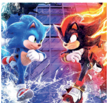
SONIC 3 (PRÉ-VENDA) Ação, Livre, Duração: 110 min