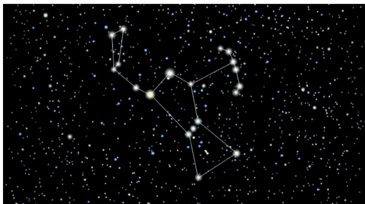
A constelação de Orion Reprodução

de poluição luminosa. O vizinho apontou para uma formação no céu, identificando-a como o Cinturão de Orion, e alegou que duas de suas estrelas eram o lar de “alienígenas bons”, enquanto uma estrela próxima abrigava “alienígenas maus”. De acordo com o vizinho, os “bons alienígenas” se assemelham aos “grays” estereotipados – pequenos seres com cabeças grandes e olhos enormes. Os “alienígenas ruins”, em contraste, são altos, de pele morena, emitem um odor desagradável e estão de alguma forma conectados à estrela próxima. O ex-oficial militar forneceu uma explicação enigmática quando o homem pressionou seu vizinho sobre como os OVNIs viajam dessas estrelas para a Terra. Ele afirmou que os OVNIs não dependem de sistemas de propulsão tradicionais, como motores de combustão. Em vez disso, sua tecnologia supostamente aproveita a eletricidade do próprio espaço, permitindo-lhes criar um “vazio” no espaço. Esse vazio permite que os OVNIs essencialmente “caiam” através dele, tornando