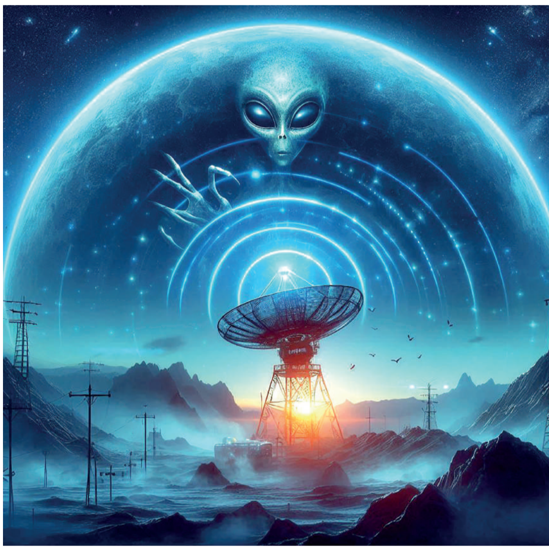
Novas descobertas se aprofundaram nos dados coletados das sondas distantes da NASA n3m3/Bling/Copilot

Seguindo o cronograma prospectivo que a equipe apresentou em seu artigo, Isaacson recentemente ofereceu detalhes adicionais sobre a pesquisa de sua equipe em um e-mail para o The Debrief. Isaacson disse: “Nossas estimativas de quando podemos esperar uma resposta de uma civilização alienígena são baseadas no período de tempo necessário para que nossos sinais de rádio, viajando à velocidade da luz, alcancem a estrela mais próxima que está em seu caminho”. Ele explicou: “A Terra está constantemente transmitindo sinais de