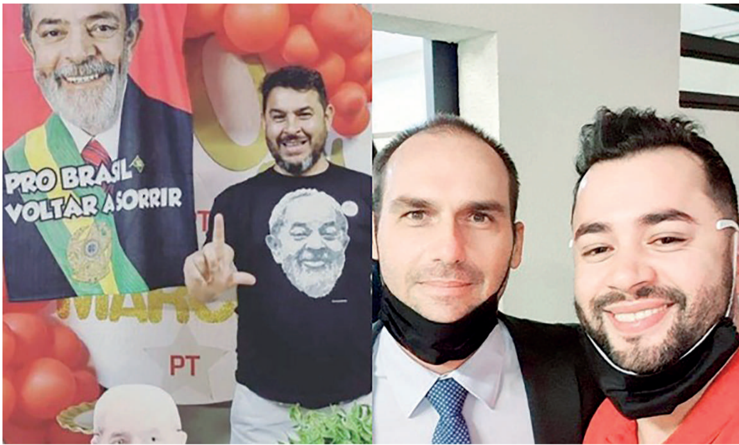
O caso será analisado no Tribunal do Júri de Curitiba no dia 11 de fevereiro, uma terça-feira.