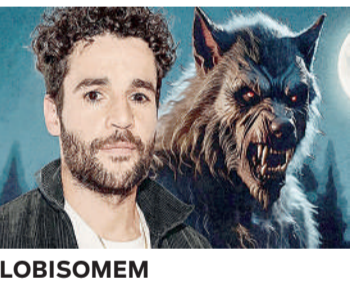
LOBISOMEM Terror, 16 anos, Duração: 103 minutos