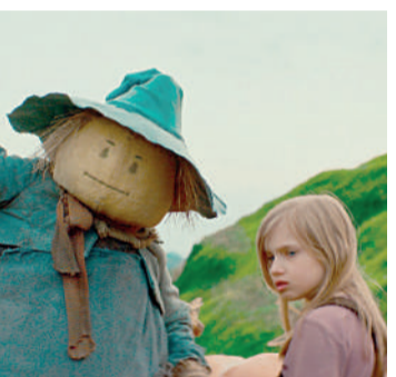
O MARAVILHOSO MÁGICO DE OZ Aventura, 10 anos, Duração: 120 minutos