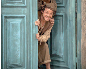
O AUTO DA COMPADECIDA 2 Comédia, 12 anos, Duração: 104 min, West Side, Cine Laser

MMA- MEU MELHOR AMIGO Drama, 12 anos, Duração: 120 min, minutos, Cine Laser, CineFlix,