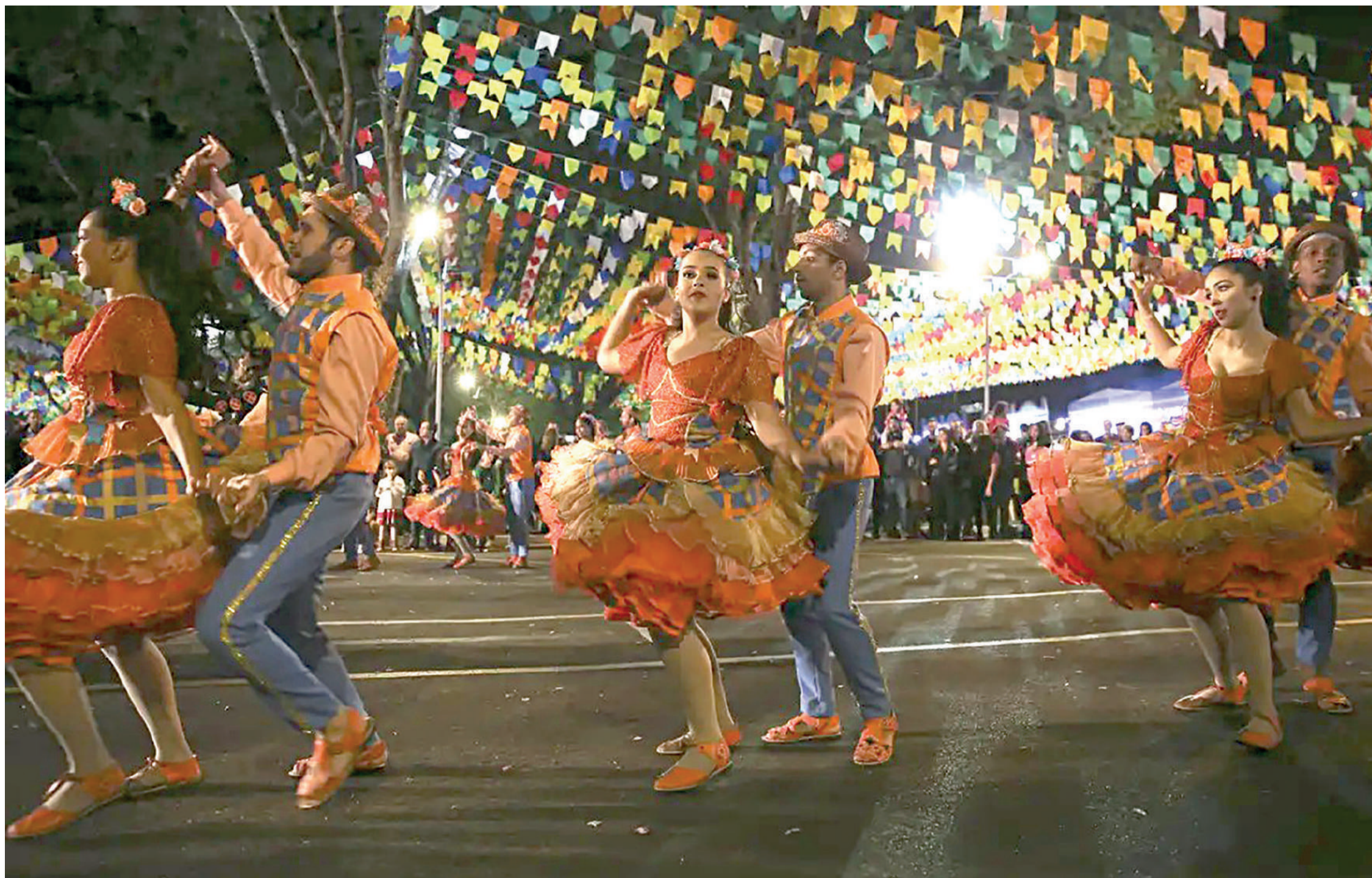
Festa Junina é a festa mais citada em todas as capitais do Brasil