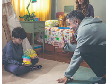
MMA- MEU MELHOR AMIGO Drama, 12 anos, Duração: 120 minutos