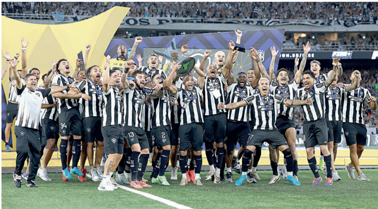
O Fogão disputa a Supercopa porque venceu o Brasileirão em 2024

Em 2024, os clubes se enfrentaram três vezes, sendo uma pelo Cariocão e outras duas pelo Campeonato Brasileiro. No retrospecto, melhor para o Alvinegro, que venceu as duas últimas partidas,