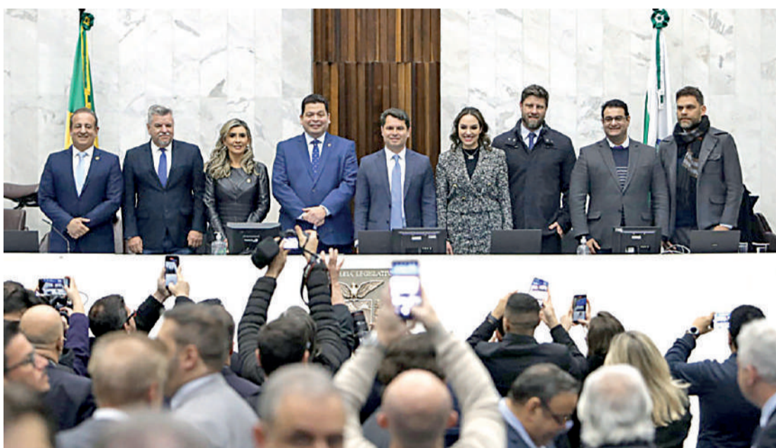
Nova mesa diretora da Alep assume nesta segunda-feira