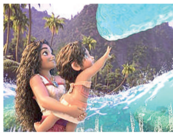
MOANA 2 Animação, Livre, Duração: 100 min