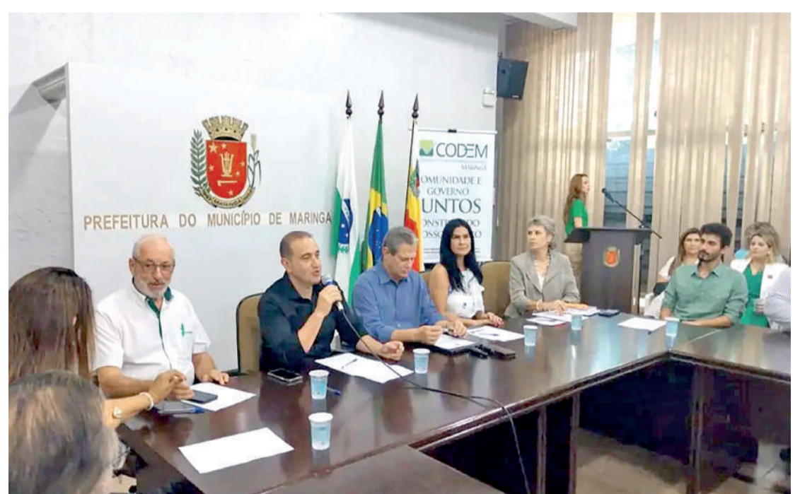
Prefeitura de Maringá quer retomar projeto de transposição da UEM.

A nota divulgada pelo Sindicato dos Docentes da UEM (Sesduem) questiona a legitimidade do anúncio feito pelo prefeito. Segundo o sindicato, a afirmação de que a reitoria autorizou a obra representa uma “grave interferência na autonomia e na