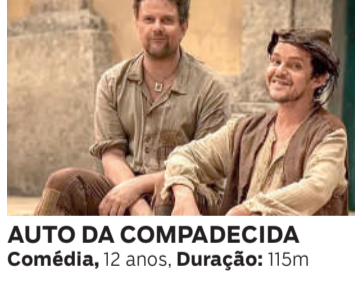
AUTO DA COMPADECIDA Comédia, 12 anos, Duração: 115 min