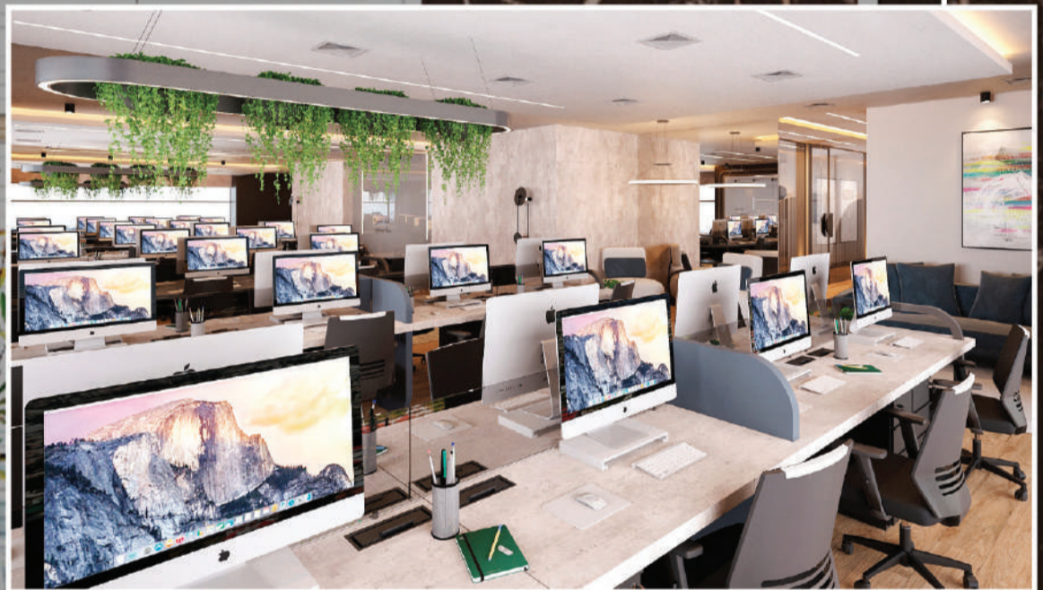
OFFICE ¼ DE ANDAR