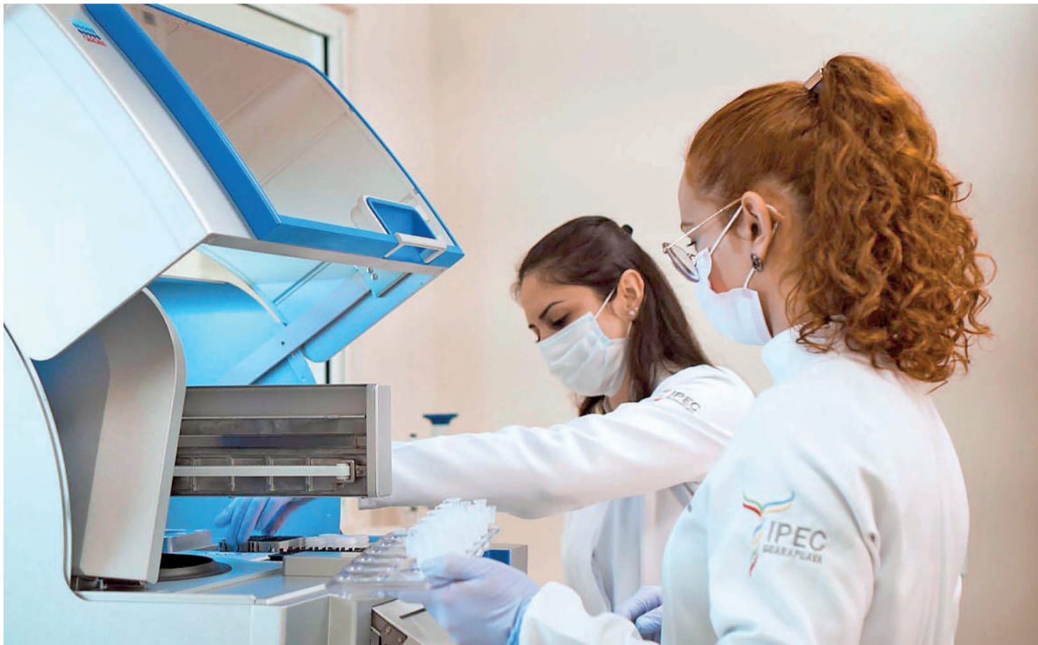
Os centros de pesquisa são responsáveis por fazer a coleta das amostras IPEC Guarapuava

Com investimentos que já ultrapassam os R$ 6 milhões, o projeto Genomas Paraná busca descrever o perfil genético e epidemiológico dos paranaenses