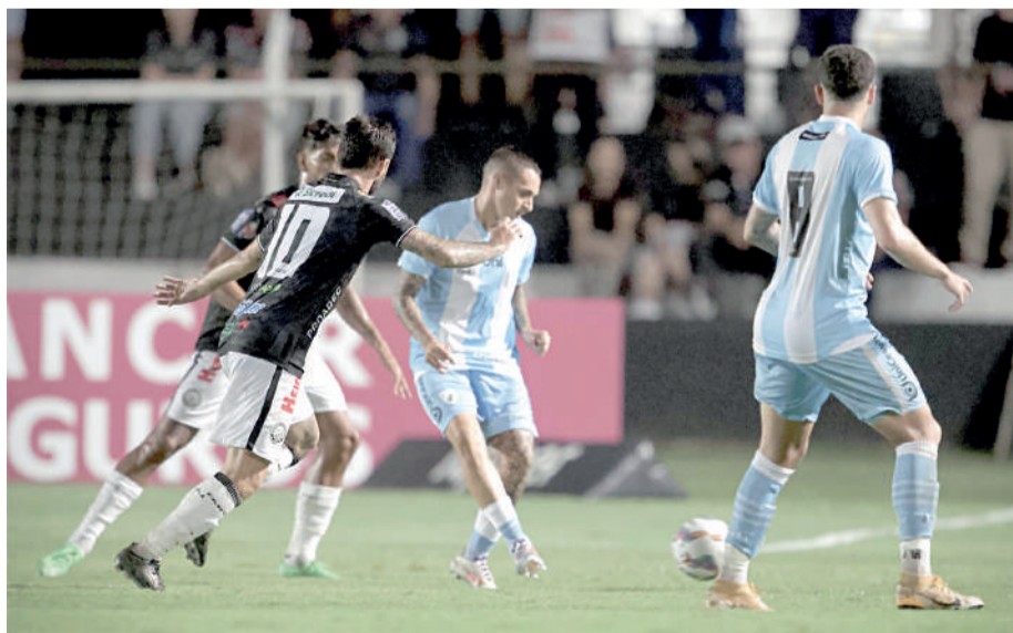
O Tubarão derrotou o Operário fora de casa André Jonsson

Quem também joga neste domingo é o Athletico-PR. O atual