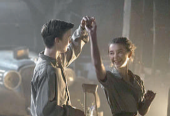
PÁSSARO BRANCO: UMA HISTÓRIA EXTRAORDINÁRIA Drama, 14 anos, Duração: 121 min

MOANA 2 Animação, Livre, Duração: 100 min