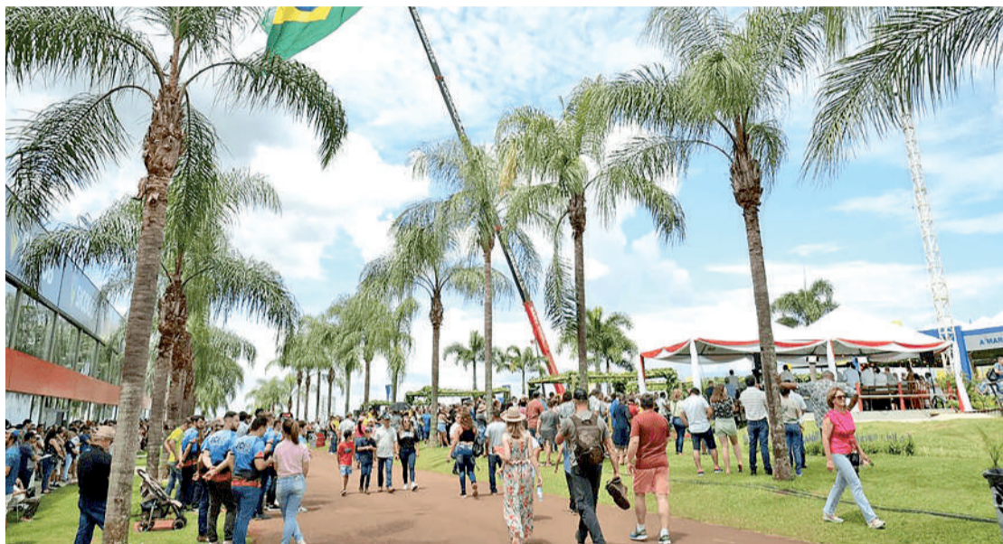
O Show Rural inicia no próximo dia 09 de fevereiro.

Cascavel dispõe de uma infraestrutura hoteleira robusta, com cerca de 5 a 6 mil leitos. Durante a semana do evento, todos esses leitos são ocupados naturalmente. Algumas empresas reservam vagas logo após o término da edição anterior, e as últimas disponibilidades costumam ser preenchidas até agosto ou, no máximo, setembro. Embora os hotéis da cidade não sejam diretamente ligados à organização do Show Rural, eles desempenham um papel fundamental no sucesso do evento. Diante disso, a direção do Sindicato dos Hotéis, Bares e Restaurantes e a Coopavel iniciaram um diálogo para fortalecer essa relação. “Estamos buscando aprimorar a integração entre o evento e a cidade. É essencial que toda a cadeia envolvida – desde hotéis e restaurantes até o comércio e a mão de obra – esteja alinhada para oferecer um acolhimento adequado aos visitantes, expositores e colaboradores. Afinal, o sucesso do Show Rural não se limita ao espaço do evento; ele se reflete também na experiência proporcionada pela cidade. Por isso, essa reunião tem