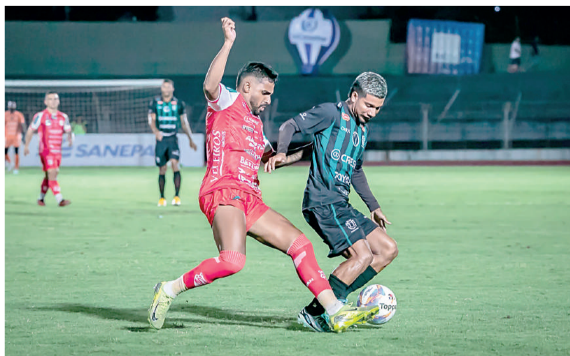
O Maringá é o vice-líder e tem o melhor ataque do campeonato

que possamos permanecer fortes em campo e na arquibancada e, assim, conquistar um bom resultado no clássico”, disse.