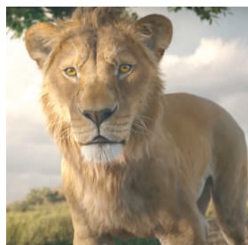
MUFASA: O REI LEÃO Animação, Livre, Duração: 126 min, West Side, Cine Laser