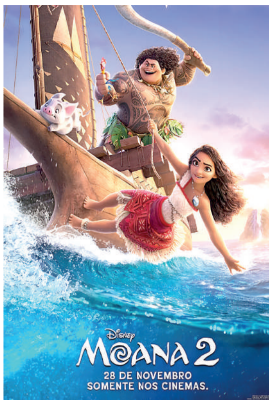
MOANA 2 Animação, Livre, Duração: 100 min, Cine Laser, West Side