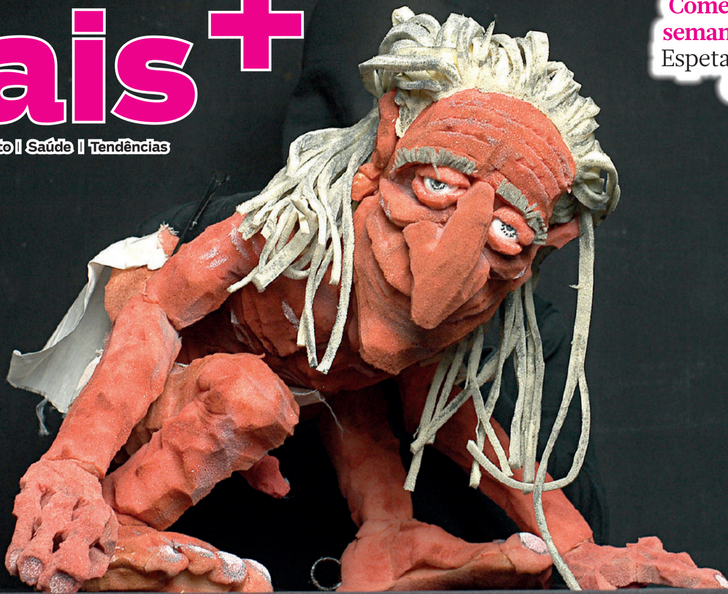
Os 8 personagens são bonecos de diferentes técnicas e tamanhos

Começa neste fim de semana o 24º Festival Espetacular de Teatro de Bonecos, no Teatro Guaíra