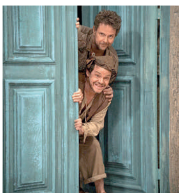
O AUTO DA COMPADECIDA 2 Comédia, 12 anos, Duração: 104 min, West Side, Cine Laser