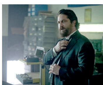
COVIL DE LADRÕES 2 Ação, 16 anos, Duração: 90 minutos