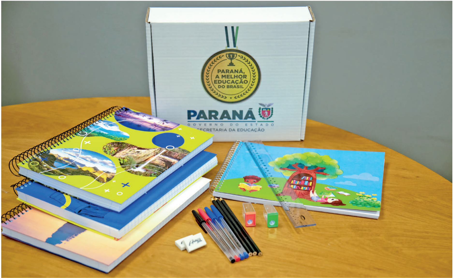
Governo entrega pela primeira vez kits escolares para alunos da rede estadual

Os kits foram elaborados para atender às necessidades pedagógicas as etapas escolares. Cada modelo foi cuidadosamente montado para garantir que os alunos tenham o suporte necessário para as atividades, desde a criatividade no Fundamental I até instrumentos de precisão