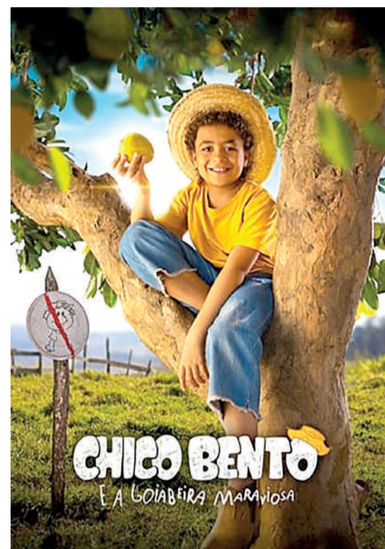
CHICO BENTO E A GOIABEIRA MARAVIOSA Aventura, Livre, Duração: 101 min, Cine Laser, CineFlix