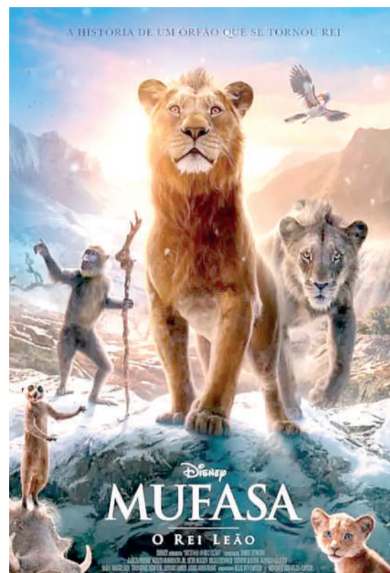
MUFASA: O REI LEÃO Animação, Livre, Duração: 126 min, West Side, Cine Laser