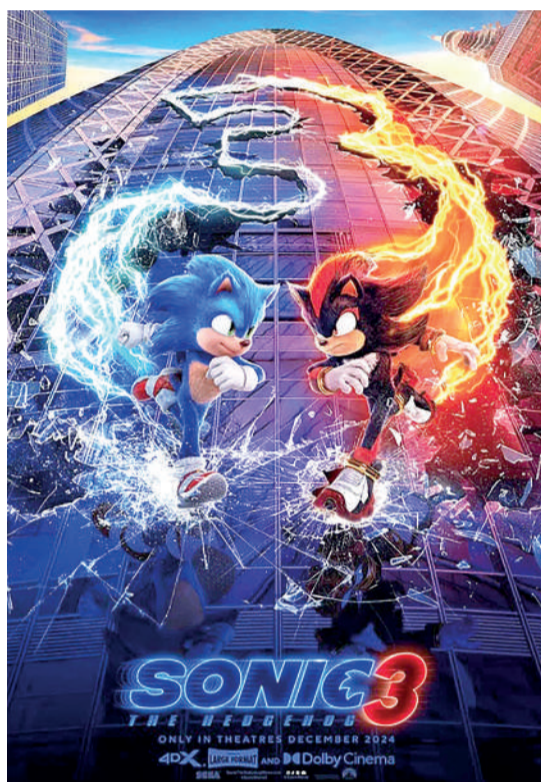
SONIC 3: O FILME Animação, 10 anos, Duração: 109 min, West Side, Cine Laser