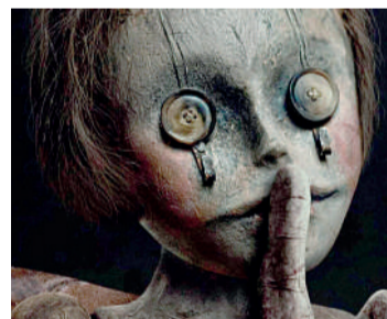
O HOMEM DO SACO Terror, 14 anos, Duração: 92 minutos