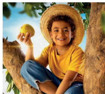
CHICO BENTO E A GOIABEIRA MARAVIOSA Aventura, Livre, Duração: 101 min, Cine Laser, CineFlix