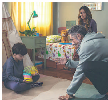
MMA- MEU MELHOR AMIGO Drama, 12 anos, Duração: 120 minutos