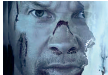
AMEAÇA NO AR Suspense, 14 anos, Duração: 105 minutos