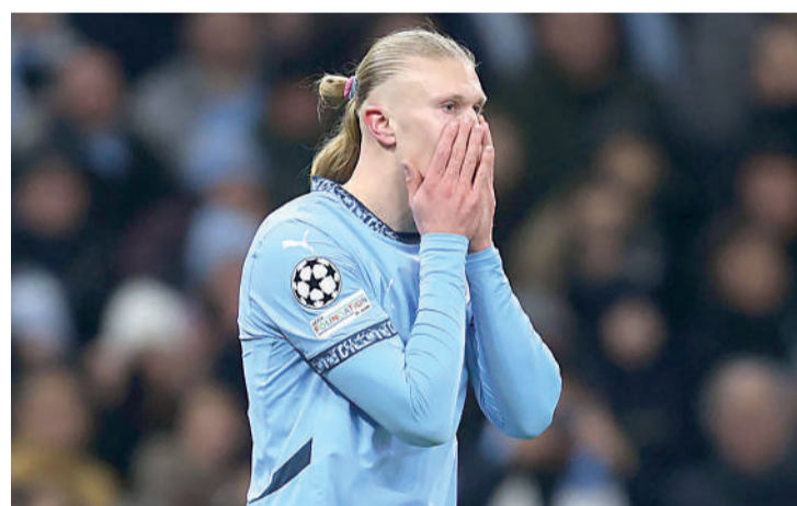
O City cruza com o Real, maior campeão da Champions Gazeta Esportiva

O Liverpool foi o time de melhor campanha na fase classificatória da Champions. O time inglês somou 21 pontos em oito jogos