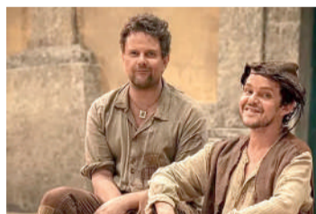
AUTO DA COMPADECIDA Comédia, 12 anos, Duração: 115 min