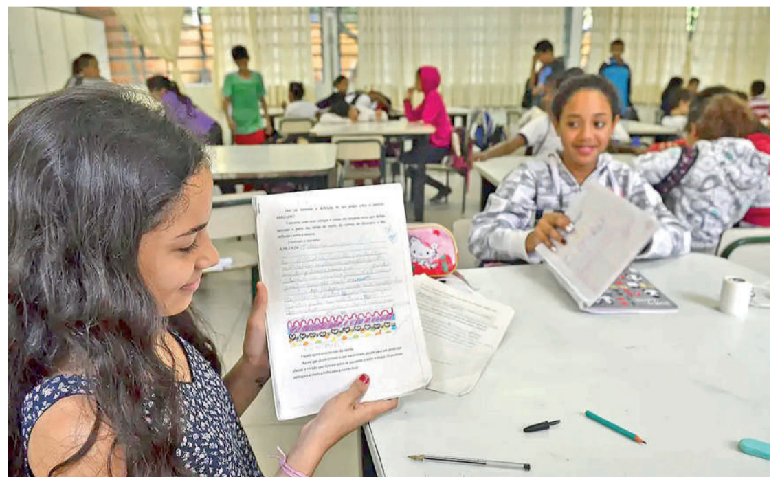
As remunerações são pagas por prefeituras e estados a partir de recursos do FUNDEB

Instituto Paranaense de Desenvolvimento Econômico e Social (Ipardes), Jorge Callado, o crescimento é resultado do desempenho positivo da economia paranaense em todos estes setores. “Um exemplo é a produção industrial, que cresceu 4,9% no Estado em novembro, quanto