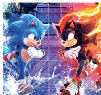
SONIC 3 (PRÉ-VENDA) Ação, Livre, Duração: 110 min