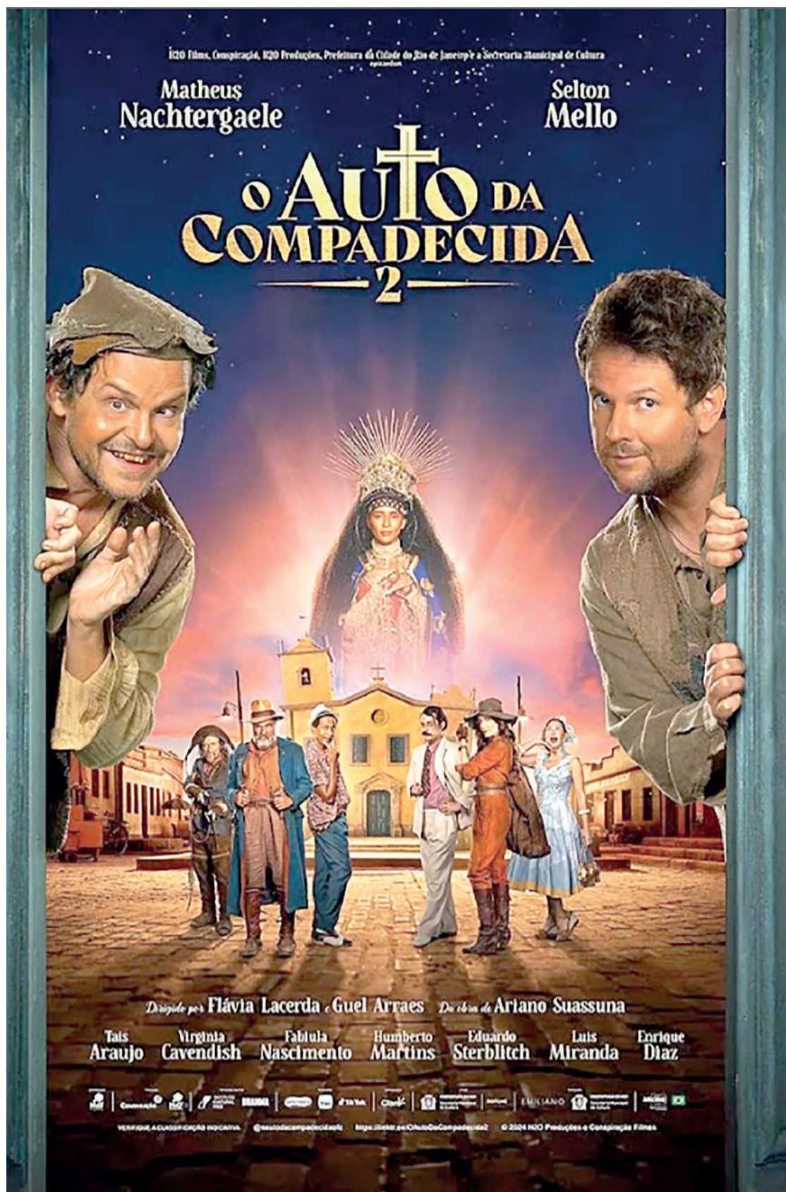
O AUTO DA COMPADECIDA 2 Comédia, 12 anos, Duração: 104 min, West Side, Cine Laser

(Confira disponibilidade de horários no site)