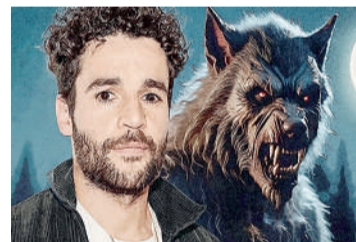
LOBISOMEM Terror, 16 anos, Duração: 103 minutos