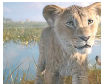
MUFASA: O REI LEÃO Aventura, Livre, Duração: 120 min