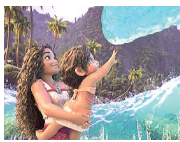
MOANA 2 Animação, Livre, Duração: 100 min