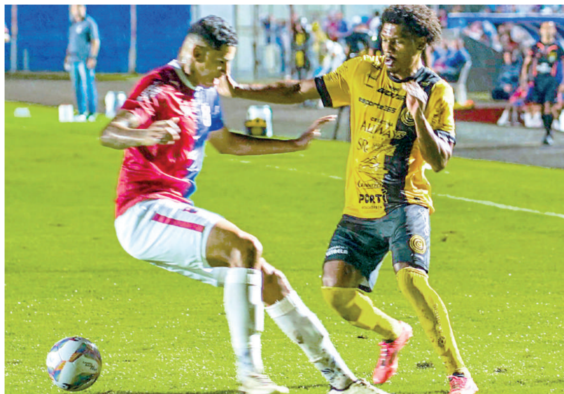
O Cascavel somou um pontinho contra o Paraná