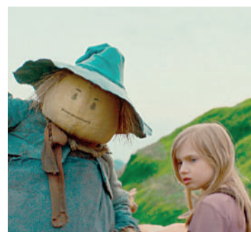
O MARAVILHOSO MÁGICO DE OZ Aventura, 10 anos, Duração: 120 minutos