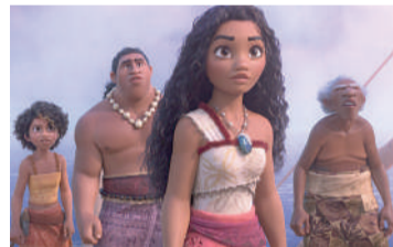
MOANA 2 Animação, Livre, Duração: 100 min, Cine Laser, West Side