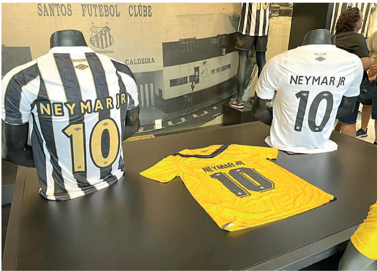
O efeito Neymar tomou conta da Vila Belmiro