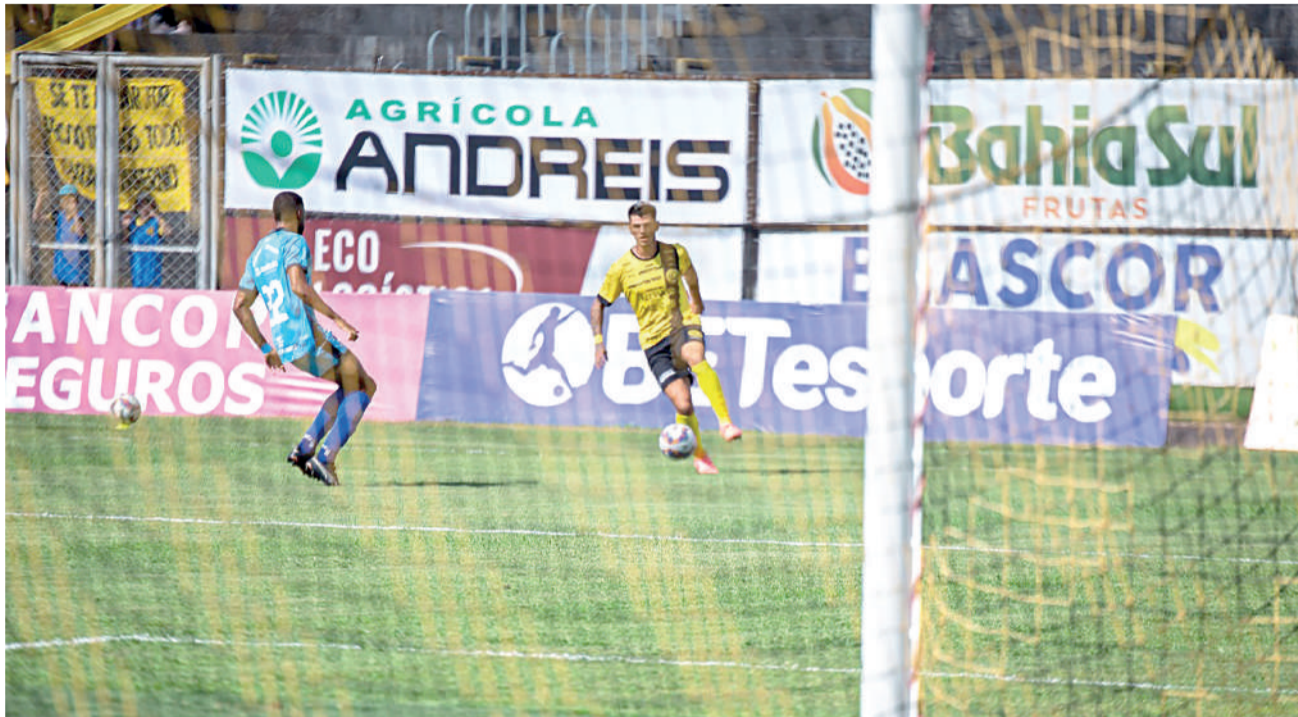
O Cascavel derrotou o Azuriz e tem outra 'Gralha' no caminho