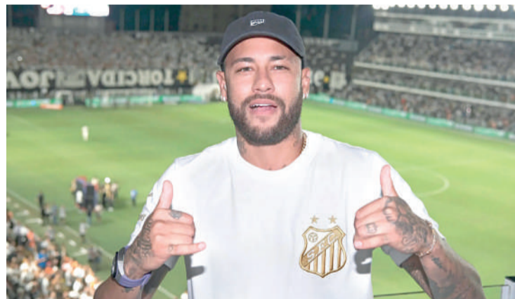
Neymar está quase de volta ao Santos

Neymar defendeu o Santos de 2009 até 2013, com 136 gols em 225 jogos, conquistando os títulos da Libertadores, da Copa do Brasil e do Paulistão