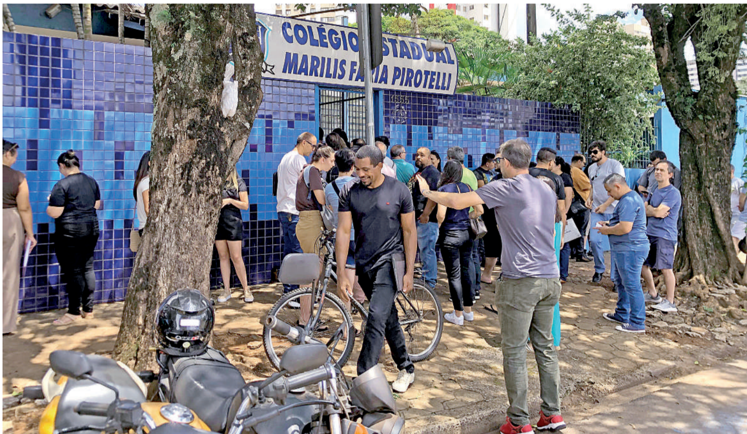
Ontem, a movimentação de docentes foi intensa em frente ao Colégio Marilys Faria Pirotelli.

No entanto, segundo a tabela à qual a Gazeta teve acesso, as vagas oferecidas pelo Grupo Salta preveem uma carga de