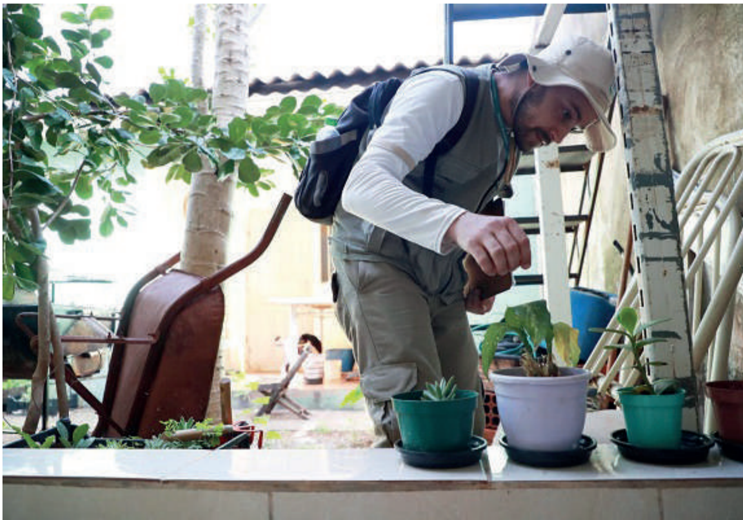
Cascavel fará uma força-tarefa na Região Norte em combate ao Aedes aegypti