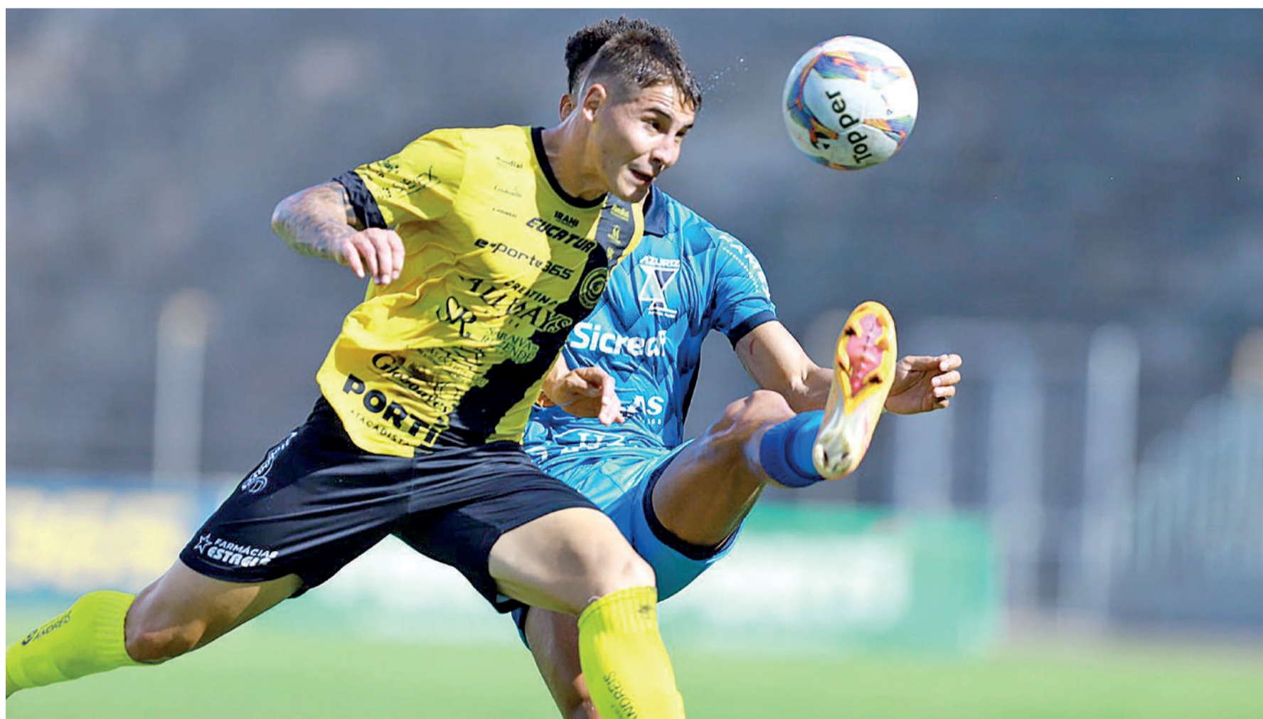
O Cascavel está embalado pela vitória sobre o Azuriz, no último domingo, no Olímpico Carlos Chiossi/Movimento e Foco