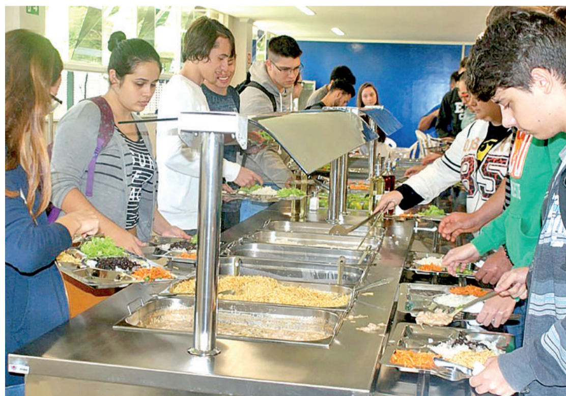
A intoxicação ocorreu na segunda-feira, no restaurante da universidade Unioeste

O Diretório Central dos Estudantes (DCE) da Unioeste em Cascavel emitiu uma nota de repúdio após o incidente de intoxicação alimentar que afetou alunos e servidores do campus. Na nota, o DCE enfatizou a necessidade de medidas imediatas para prevenir novos casos e reforçou seu compromisso com o bem-estar da comunidade acadêmica. “Reivindicamos ações