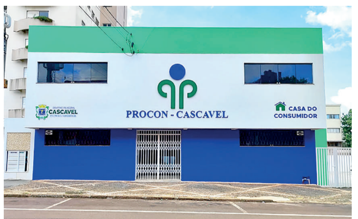
O atendimento presencial ocorre de segunda a sexta-feira, das 8h30 às 14h. Secom

O Procon destaca ainda que não se pode condicionar a aquisição dos itens em estabelecimentos comerciais específicos, uma vez que o consumidor tem o direito à liberdade de escolha do fornecedor. Da mesma forma, a exigência de marcas específicas de produtos somente é justificável em situações excepcionais, quando imprescindível para atender ao projeto pedagógico, devendo ser devidamente esclarecida aos responsáveis. Caso o consumidor perceba valores ou exigências fora do comum nas listas de materiais escolares, é importante denunciar ao Procon ou buscar orientação