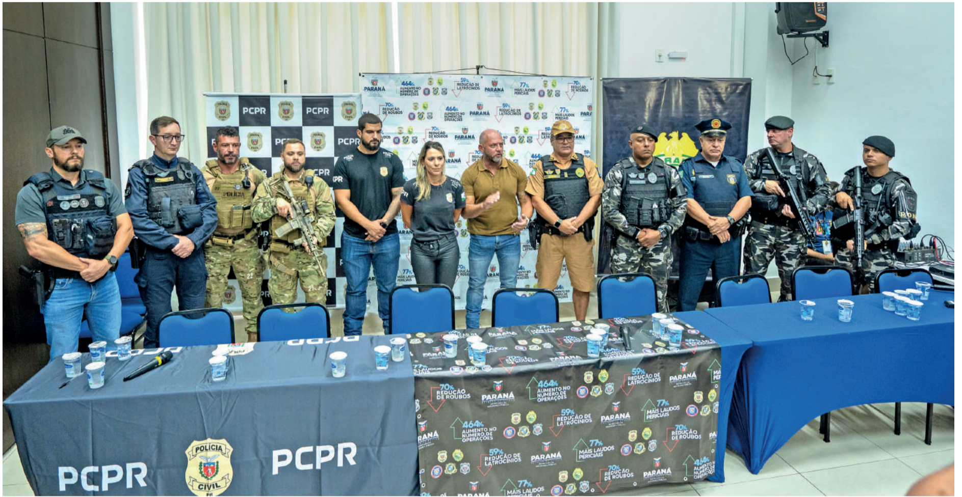
As forças de segurança do Paraná fizeram uma força-tarefa para resgatar a menina

A suspeita chegou à residência da família, no bairro Parolin, usando avental e máscara, por volta das 11h50, e apresentou-se como agente de saúde. Ela