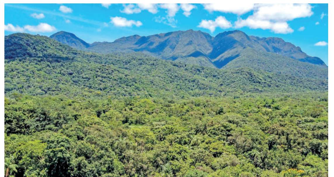
Ao todo, 236 das 399 cidades do Paraná (59%) recebem o benefício

Outro ponto é que os indicadores e procedimentos utilizados