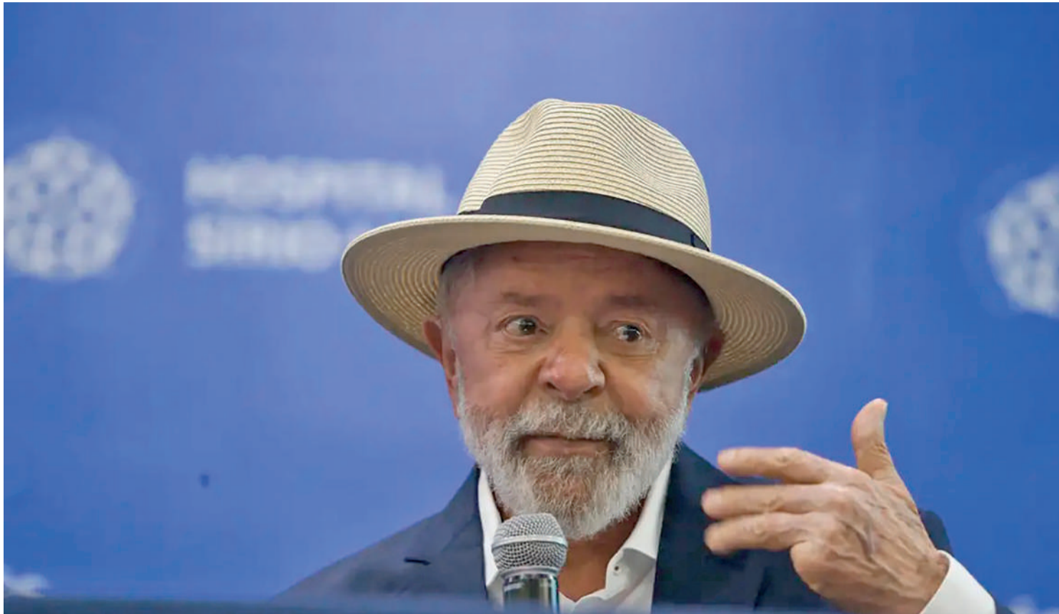
A contestação ao governo Lula tem aumentado em virtude da alta no preço dos alimentos

A declaração de Rui Costa foi ironizada na internet e transformada em meme pelos usuários. O posicionamento do ministro veio em um momento em que o governo de Luiz Inácio Lula da Silva (PT) se mobiliza em uma tentativa de baratear o preço dos alimentos para melhorar sua popularidade. “O preço internacional está tão alto quanto aqui. O que se pode fazer? Mudar a fruta que a gente vai consumir. Em vez da laranja, outra fruta. Não adianta baixar a alíquota porque não tem produto lá fora