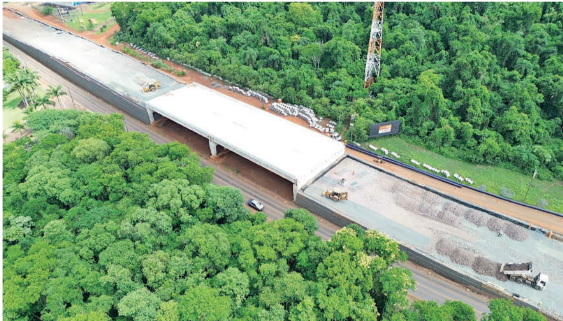
O trecho interliga o acesso a Argentina até o portal de entrada do Parque Nacional de Iguaçu DER

•A duplicação da Rodovia das Cataratas (BR-469) que antes era uma salvação, se tornou um martírio para o morador de Foz do Iguaçu. Constantes atrasos e problemas cercam a obra que foi iniciada em 2022 com o prazo de execução de 18 meses, e até o momento não foi concluída pela construtora Dalba Engenharia. O prazo para finalização, março de 2024, já passou a 10 meses, e a tendência é que se estenda ainda por muito mais tempo, já que a obra não chegou nem na sua metade. Conforme o último balanço, a duplicação está atualmente em apenas 42,49% de execução. Recentemente a Prefeitura de Foz do Iguaçu fez uma cobrança ao governo do estado, pedindo mais agilidade na execução das