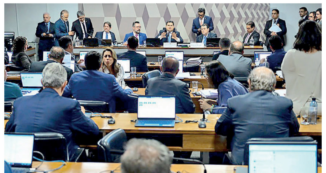
Quase 60% das proposições na CCJ são relatadas por senadores da oposição