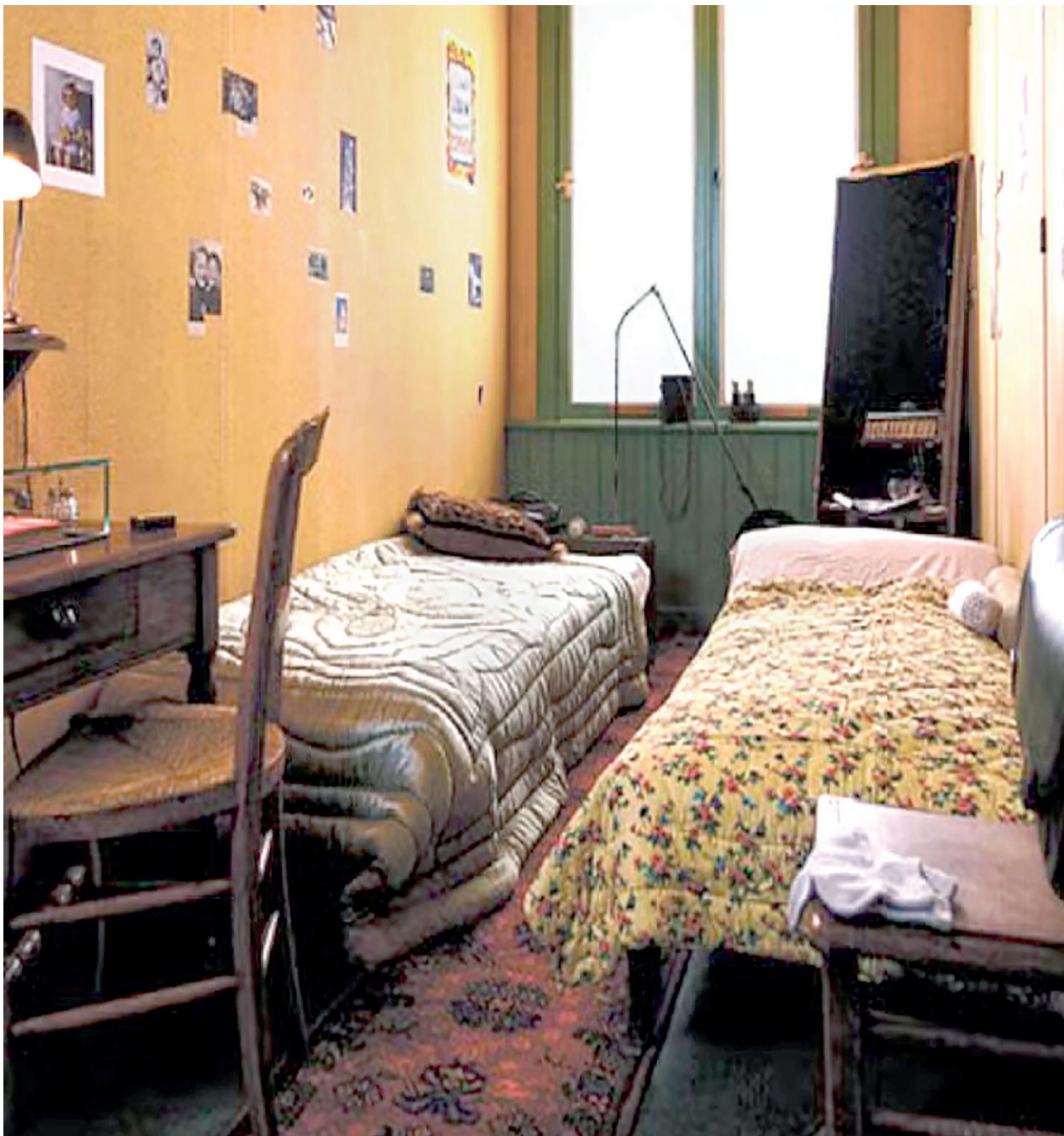
Recriação do quarto onde Anne Frank dormia clandestinamente em Amsterdã.

Os visitantes veem a imagem pela primeira vez antes de percorrerem o núcleo da mostra: a primeira recriação em escala real do anexo secreto que foi o esconderijo de oito judeus em Amsterdã, incluindo a família Frank, de julho de 1942 a agosto de 1944, espaço onde Anne escreveu seu famoso diário