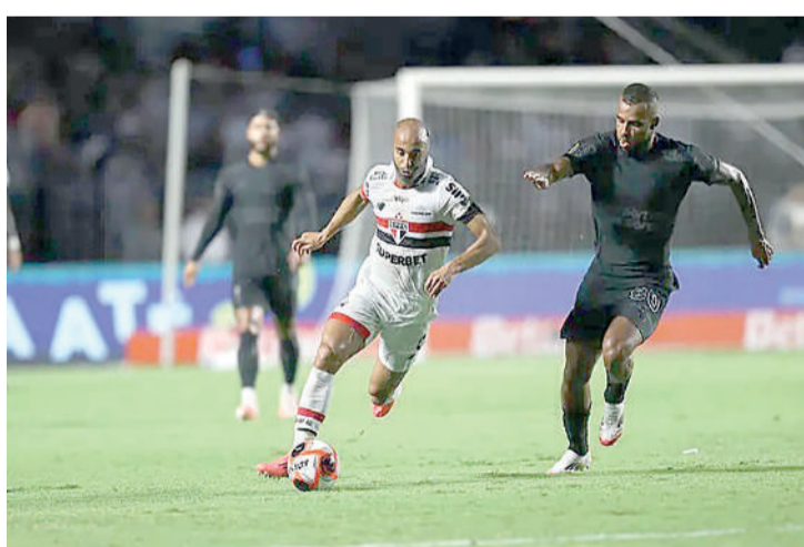
O São Paulo levou a melhor sobre o Timão Gazeta Esportiva

São Paulo conquistou o quinto título da Copa São Paulo ao derrotar o Corinthians por 3 a 2