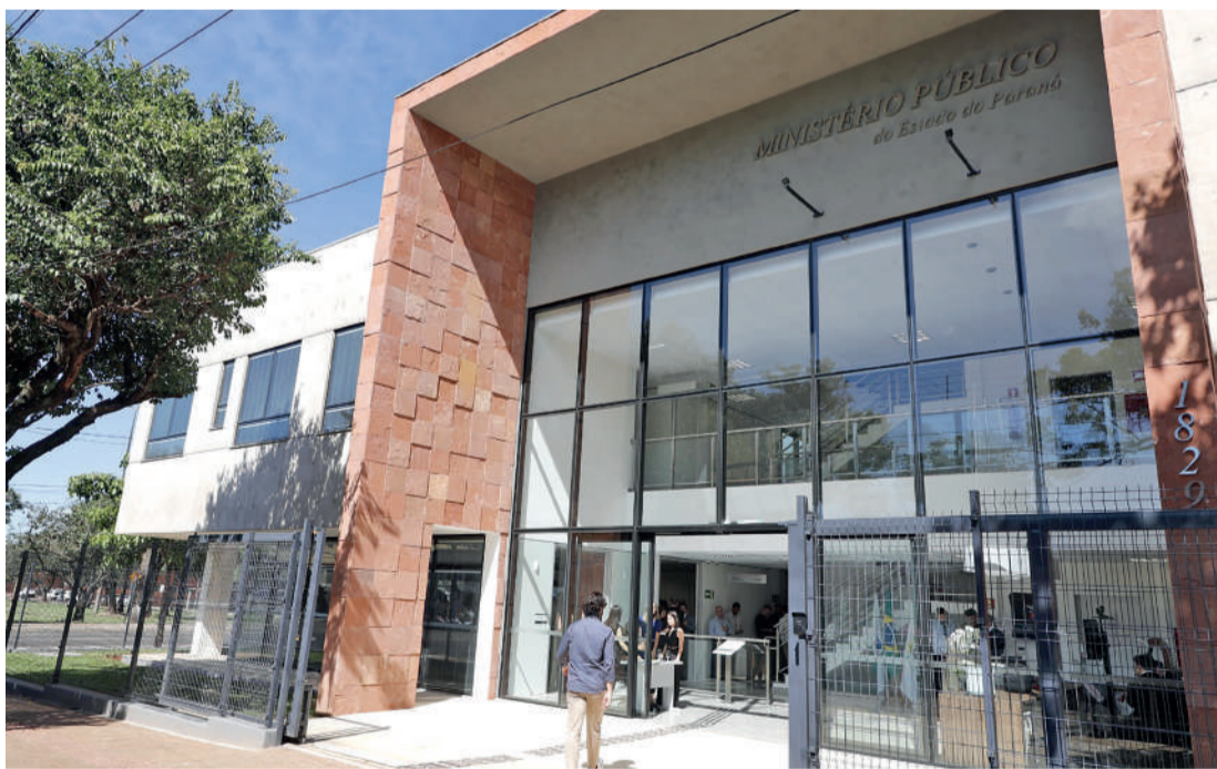
Nova sede terá atendimento de promotorias, Gaeco entre outros serviços Assessoria

Durante a solenidade, o procurador-geral de Justiça, Fran-