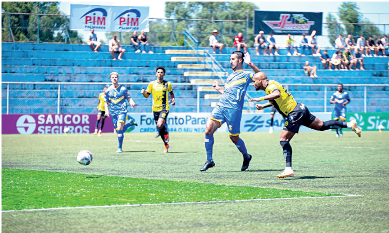
Ontem, o Cascavel empatou em 1 a 1 com o Independente São Joseense

O jogo contra o Independente São Joseense começou na quarta-feira, mas foi interrompido