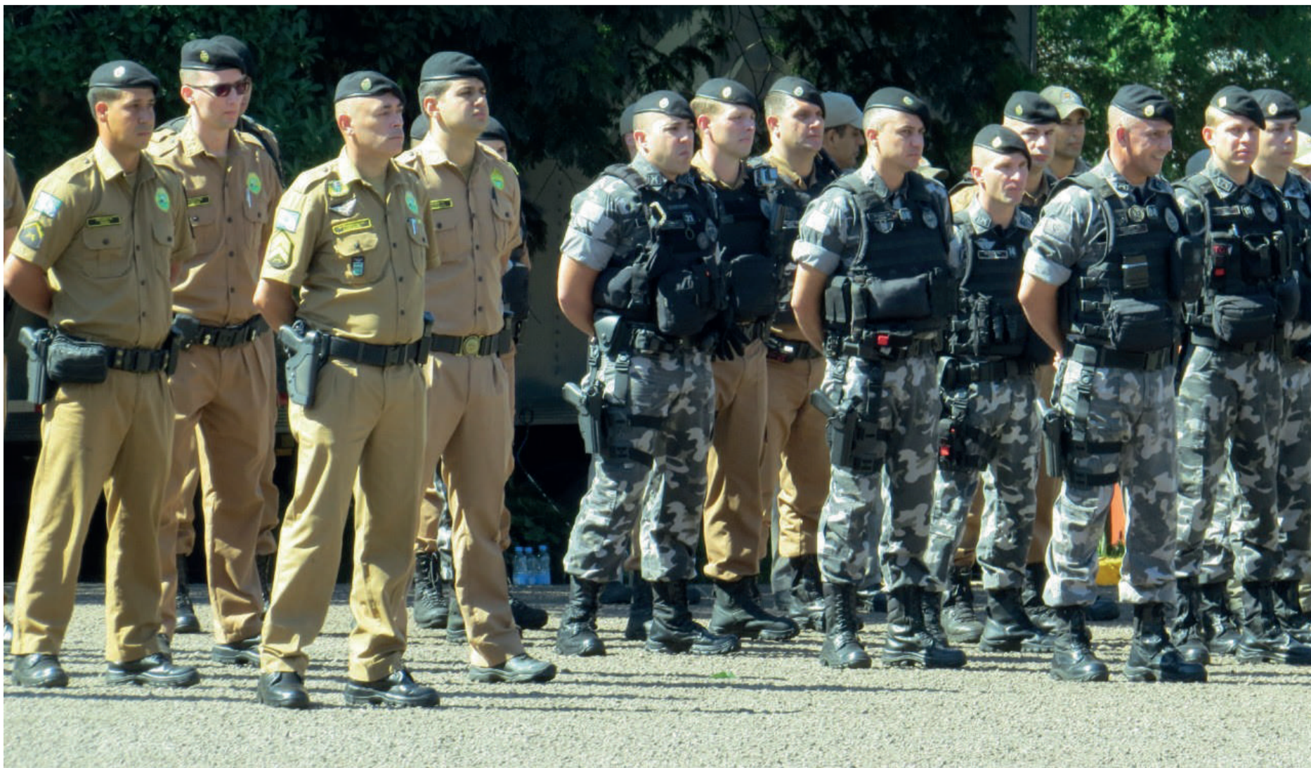
O levantamento também revelou lacunas na investigação de mortes decorrentes de confrontos

O levantamento também revelou lacunas na investigação de mortes decorrentes de confrontos, como a ausência de exames residuográficos para determinar se a vítima utilizou ou não arma de fogo. "O Paraná, até pouco tempo, não tinha equipamentos adequados para esses testes, mas a Secretaria de Segurança Pública adquiriu recentemente essa tecnologia", destacou Lois.