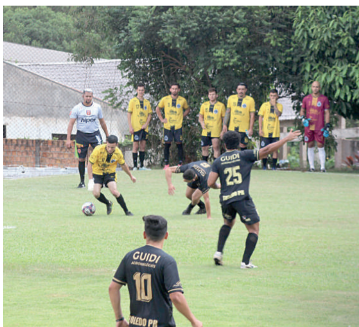
O Centralito venceu na abertura do campeonato

A primeira rodada do Campeonato Chácara Fardoski teve 38 pontos