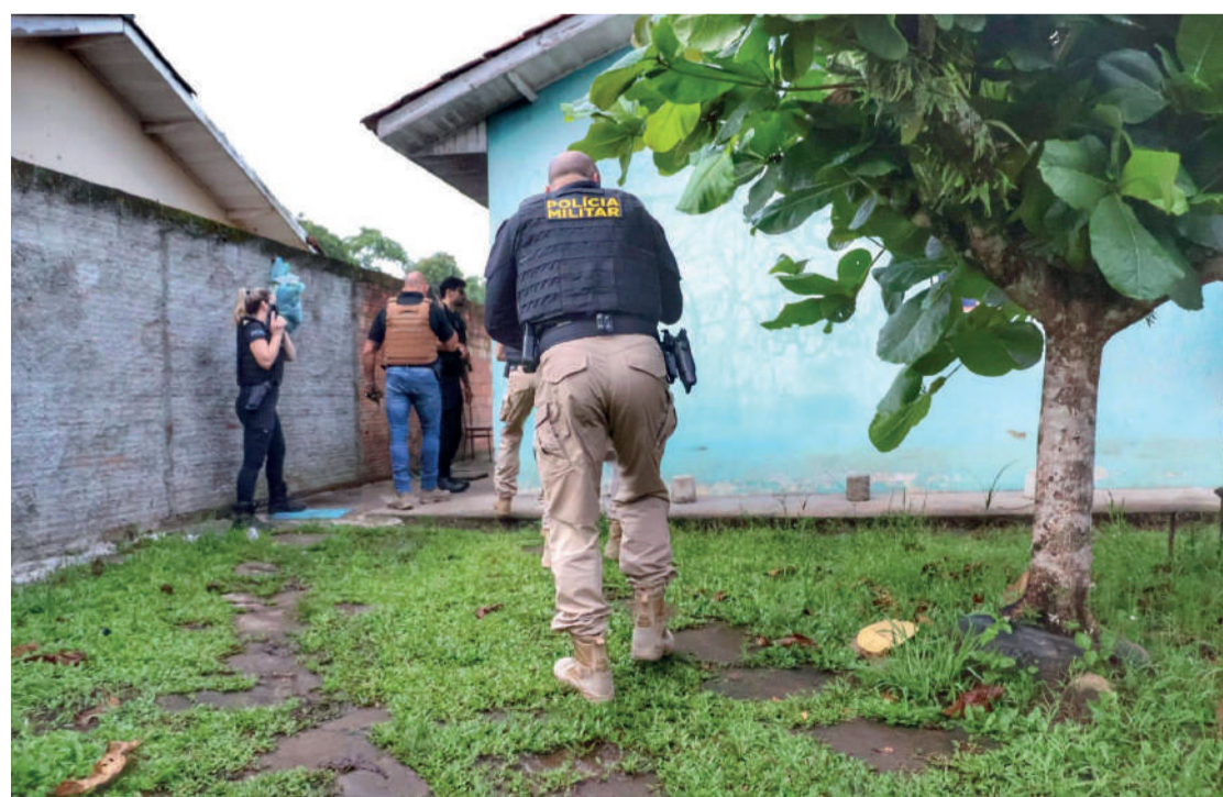
As atividades contaram com a atuação dos canis da PCPR, PM-PR e