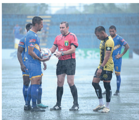
Não teve como jogar futebol ontem

partida como visitante no Paranaense. Foi na derrota para o Cianorte pela primeira rodada. Em 2024, a equipe só conseguiu uma vitória longe do Está-