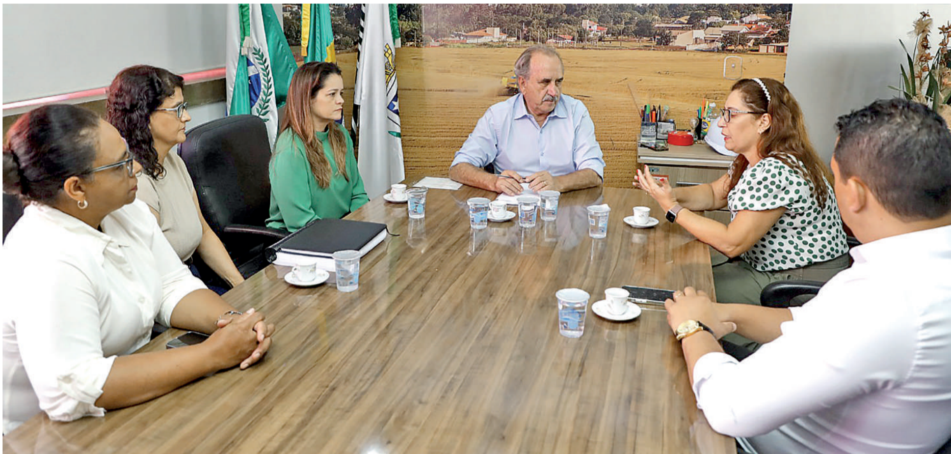
A reunião ocorreu ontem, na Prefeitura.

De acordo com o Ministério Público, atualmente em Cascavel estão em vigor cerca de cinco mil