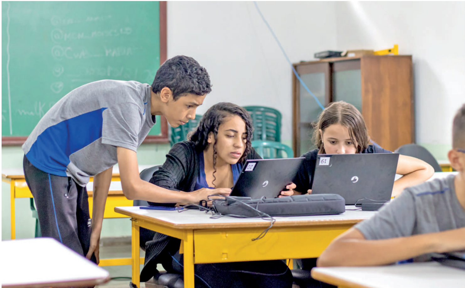
A continuidade ou não do programa ainda gera incertezas para as escolas envolvidas

O programa, sancionado em junho do ano passado, abrange atividades que incluem a manutenção e conservação das instalações escolares, a contratação de serviços terceirizados de limpeza e segurança, a gestão documental e até mesmo a preparação de refeições para os alunos. Ao todo, 82 escolas em 34 municípios serão contempladas nesta etapa inicial, com três empresas ou consórcios responsáveis pela gestão: Apogeu, Tom Educação, com apoio do grupo