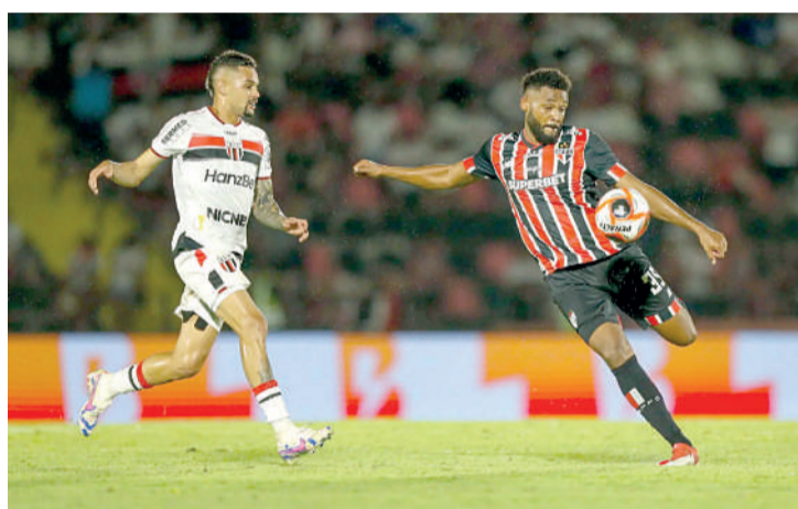
O São Paulo faz o segundo jogo no Paulista hoje