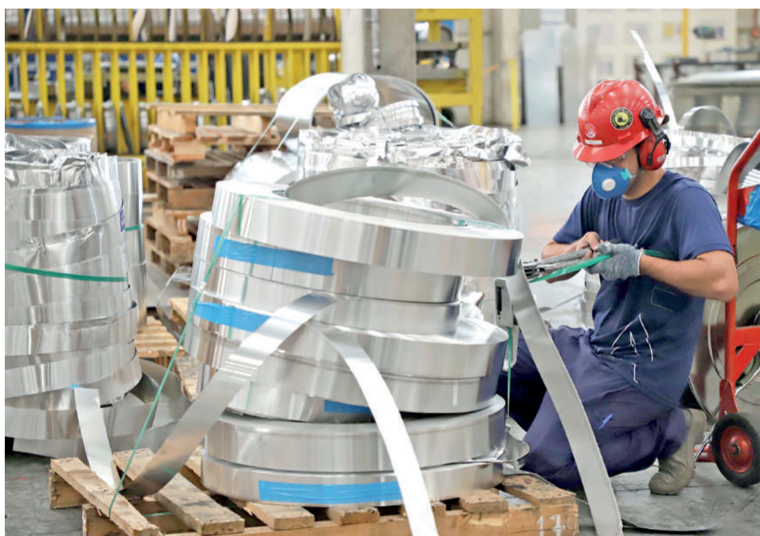
O crescimento é quase sete vezes superior à média nacional no período.

O crescimento paranaense no número de contratados nas indústrias de transformação também foi proporcionalmente superior à média nacional. Enquanto o Paraná aumentou em 17,37% sua massa de trabalhadores no segmento, o Brasil registrou um crescimento de 11,8% no mesmo período. Os números são consequência de um maior dinamismo da produção industrial local ao longo destes cinco