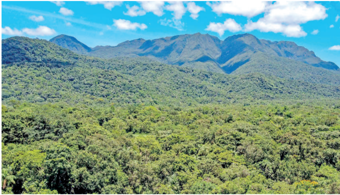
A denúncia é a melhor forma de contribuir para minimizar os crimes ambientais relacionados à supressão vegetal.

Esse valor representa um aumento de 8% em relação a 2023 (R$ 123,2 milhões) e é mais da metade (55,6%) do total de multas por crimes ambientais emitidas entre janeiro e dezembro de 2024, que somaram R$ 239 milhões. Os dados são do Sistema de Informações Ambientais (SIA) do IAT, órgão vinculado à