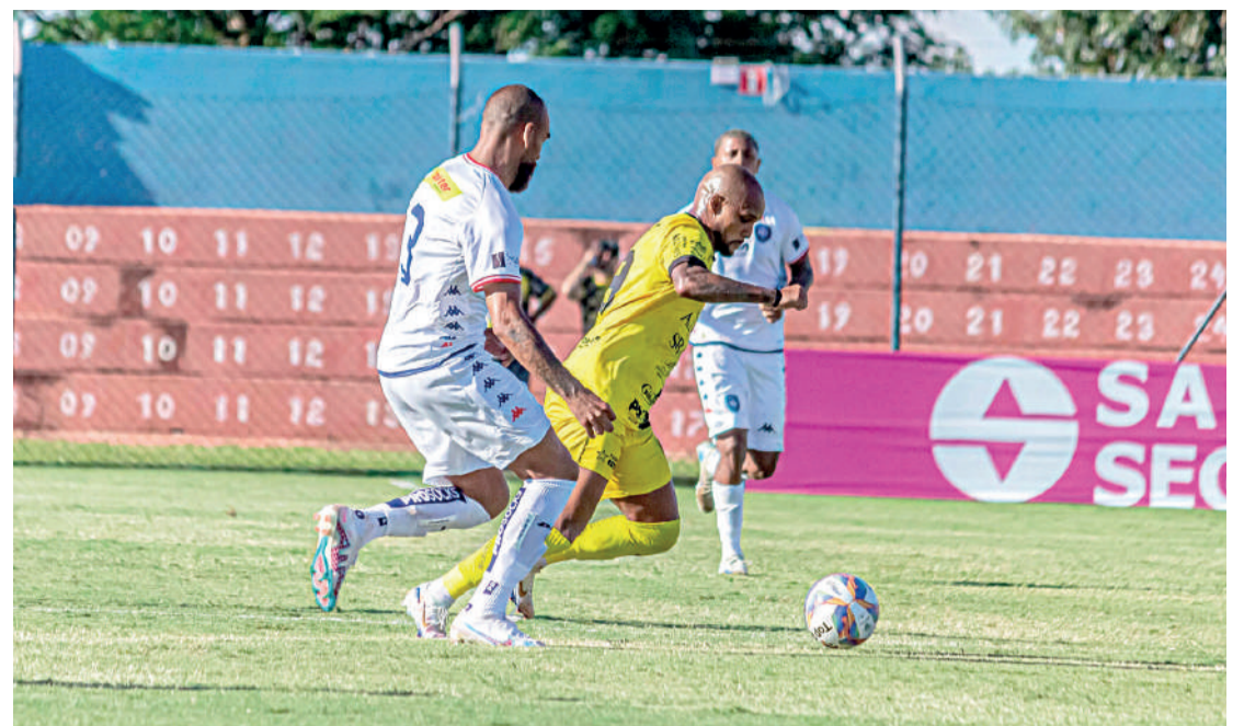
O Cascavel foi derrotado pelo Cianorte Elisandro Vieira