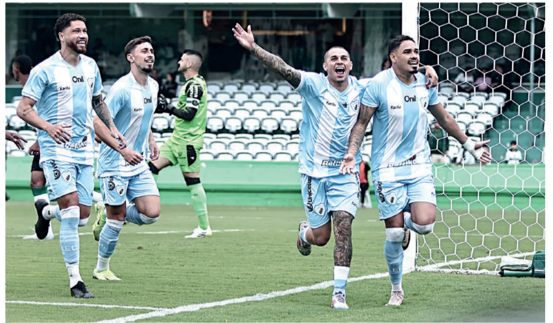
O Londrina derrotou o Coritiba na Capital