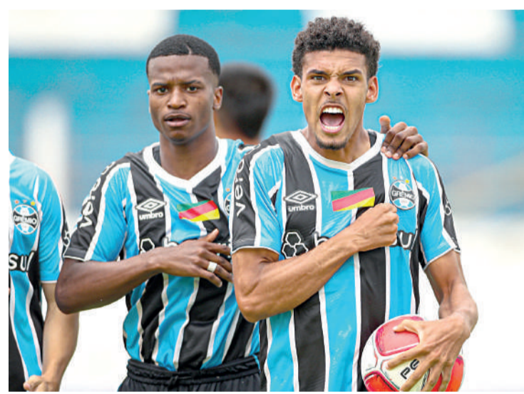
O Grêmio avançou na Copinha Site Grêmio

ceira fase da Copinha tem mais seis partidas, que vão definir mais seis classificados para as oitavas. O Botafogo enfrenta a Ponte Preta, às 21h45, em Votuporanga. Quem vencer pega o vencedor de Mirassol e Criciúma, que jogam às 15 horas. O Atlético-MG encara o Guarani, às 21h30, em Franca. Quem passar pega o vencedor do duelo paulista entre Ferroviária e Santos. Ambos jogam às 17 horas, em Araraquara. O Fluminense tem um confronto contra o Água Santa, às 19h30, em São Carlos. O vencedor deste duelo cruza com quem passar do confronto entre São Paulo e Juventude. Os dois times jogam às 18h30, em Jaú.