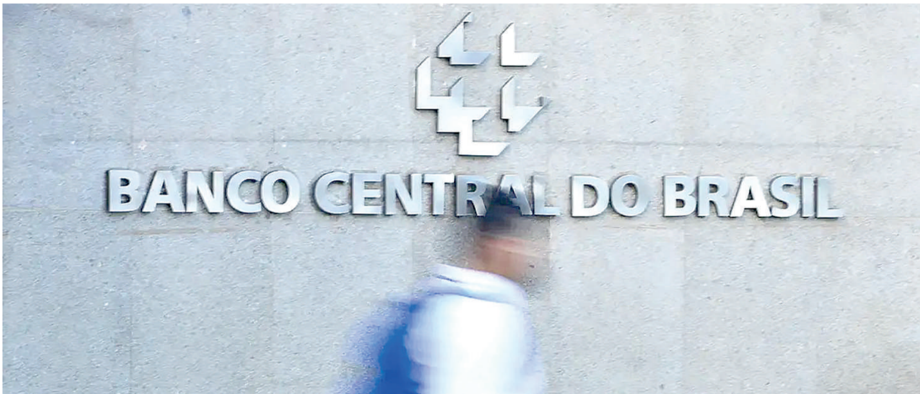
Quando o Copom aumenta a taxa básica de juros a finalidade é conter a demanda aquecida

Desde 1999, quando o Brasil passou a adotar o regime de metas de inflação, o IPCA, considerado a inflação oficial do país, ultrapassou oito vezes o limite máximo da meta. A último registro foi no ano passado, segundo dados divulgados na última sexta-feira (10) pelo Instituto Brasileiro de Geografia e Estatística (IBGE). Para 2027, a projeção do mercado financeiro é inflação de 3,9% e para 2028, de 3,56%.