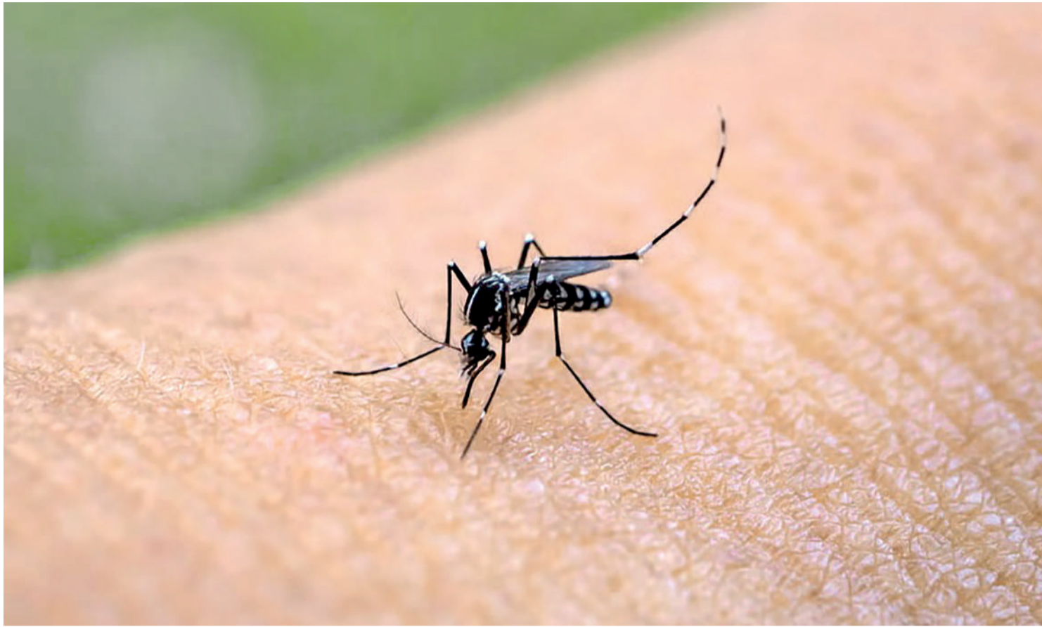
A melhor forma de evitar a doença é acabar com o mosquito

De acordo com a diretora, pequenas atitudes, como manter os quintais limpos e evitar o acúmulo de água em recipientes, são essenciais para impedir a proliferação do vetor e controlar o avanço das doenças