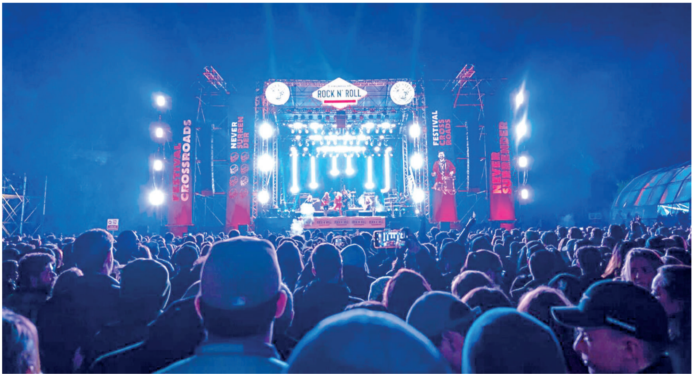
Never Surrender Photo Team