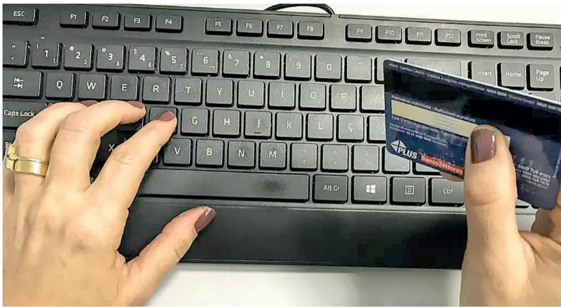
O IRRF-Capital teve uma arrecadação de R$ 9,78 bilhões

Segundo a Receita, o acréscimo observado no período pode ser explicado pelo comportamento das variáveis macroeconômicas, pelo retorno da tributação do Programa de Integração Social e da Contribuição para o Financiamento da Seguridade Social (PIS/Cofins) sobre combustíveis, pela