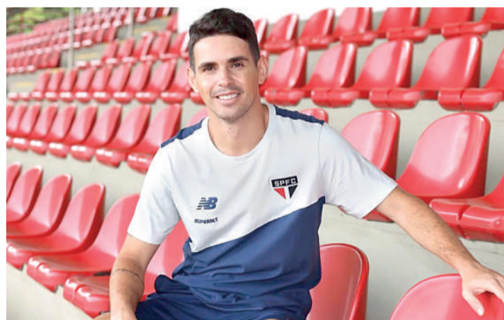
Oscar reforça o São Paulo em 2025 Site São Paulo

Segundo o site ogol, Oscar marcou 16 gols e concedeu incríveis 29 assistências em 39 partidas disputadas na temporada que passou