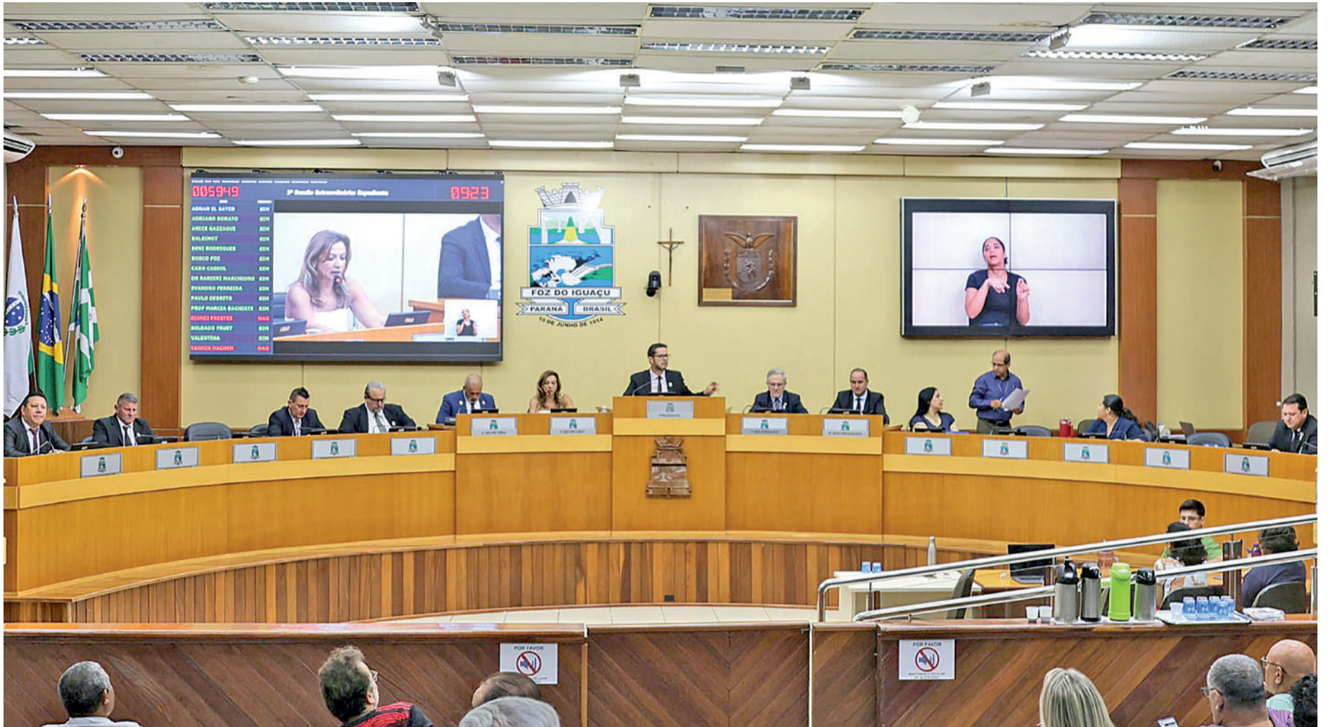
Foz do Iguaçu terá aumento de salário e pagamento de 13º para vereadores Câmara de Foz do Iguaçu

As cidades que tiveram reajustes votaram a aprovação dos mesmos no poder legislativo. Em Curitiba, o salário aumentou pouco menos de R$ 1.000. Vereadores que recebiam anteriormente R$ 19.617,82, passam a receber agora, R$ 20.484,93. O salário do presidente do poder legislativo também subiu, indo de R$ 23.890,26 para R$ 24.147,01. Em meio a isso, os servidores públicos municipais e os conselheiros tutelares também tiveram salário reajustado. Toda essa recomposição salarial