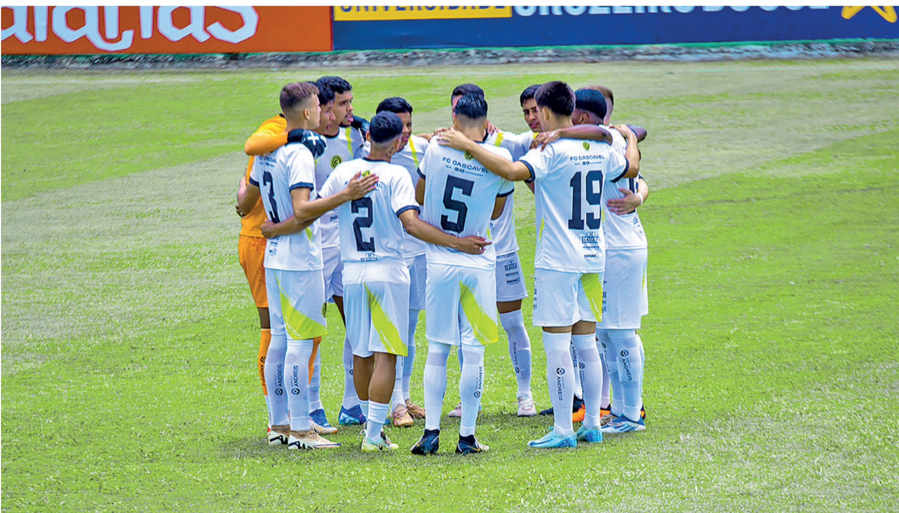
Na estreia no torneio, no domingo passado, os Piás do Ninho foram derrotado pelo Sport por 1 a 0