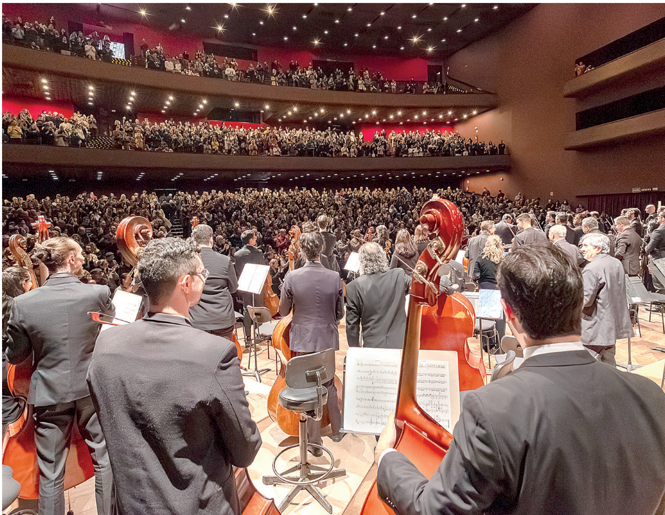
Orquestra Sinfônica prepara agenda de 2025

Ano passado , entre outros espetáculos, público foi brindado com Villa-Lobos, Sinfonias de Brahms e Gala Lírica, que uniu a Orquestra a vozes importantes do Paraná e do mundo. Em um encontro memorável, a OSP recebeu João Carlos Martins, pianista e maestro brasileiro