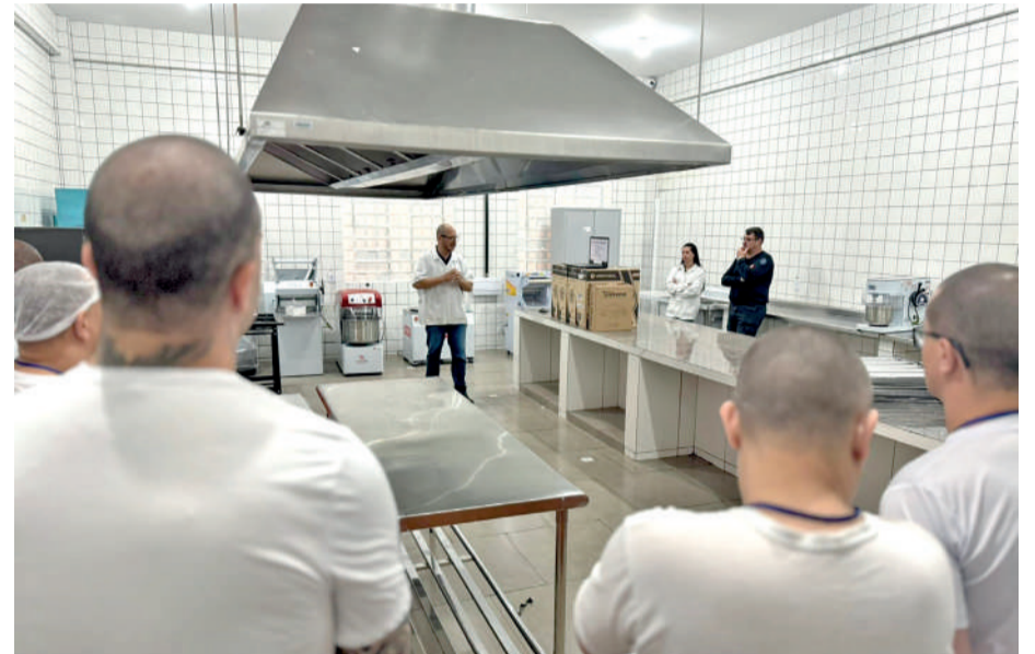
O Projeto Trabalhando a Liberdade com Dignidade foi instaurado em 2021 PPPR

tas injustificadas. Não há como designar um policial penal para vigiar cada monitorado pessoalmente, considerando que somente na nossa regional há mais de mil tornozeleiras ativas. Por isso, o sistema eletrônico é fundamental", destacou a nota da PPPR. O rapaz era monitorado por tornozeleira eletrônica desde 23 de novembro de 2023