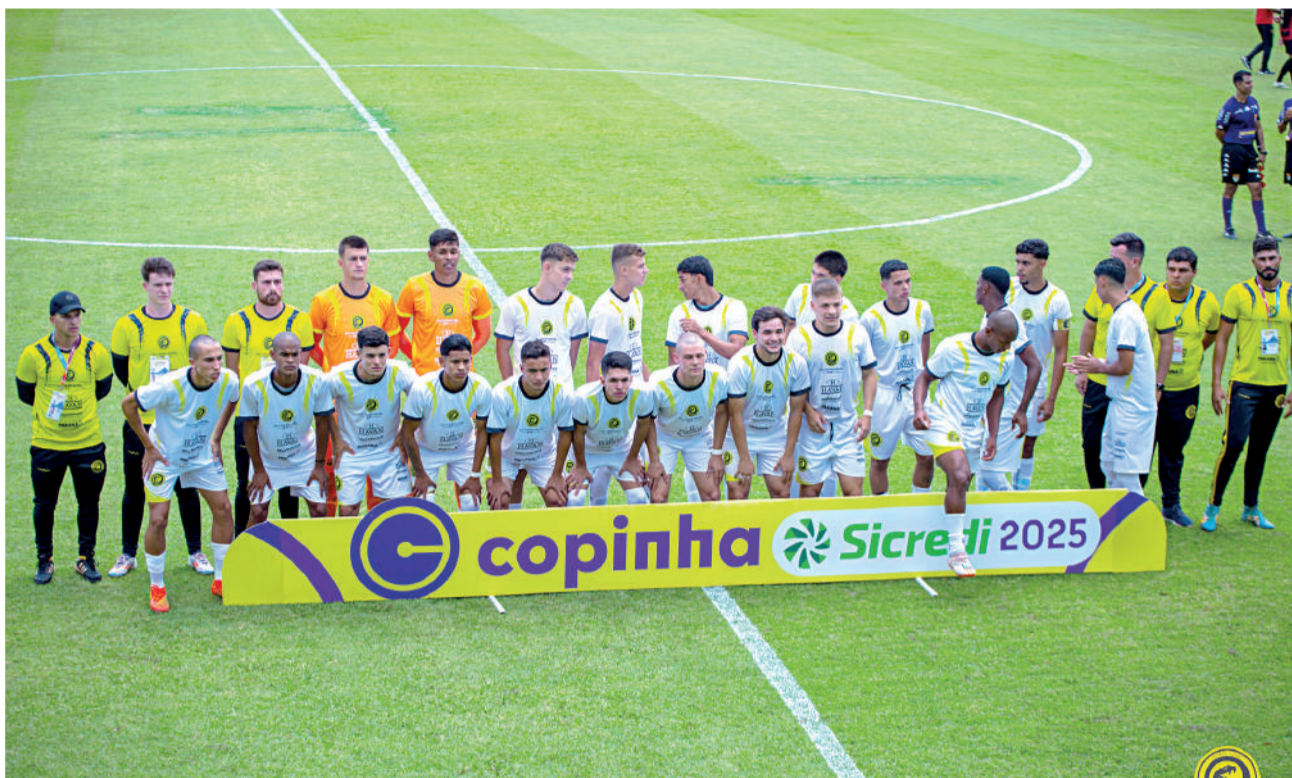
O Cascavel foi superado pelo Sport no último domingo