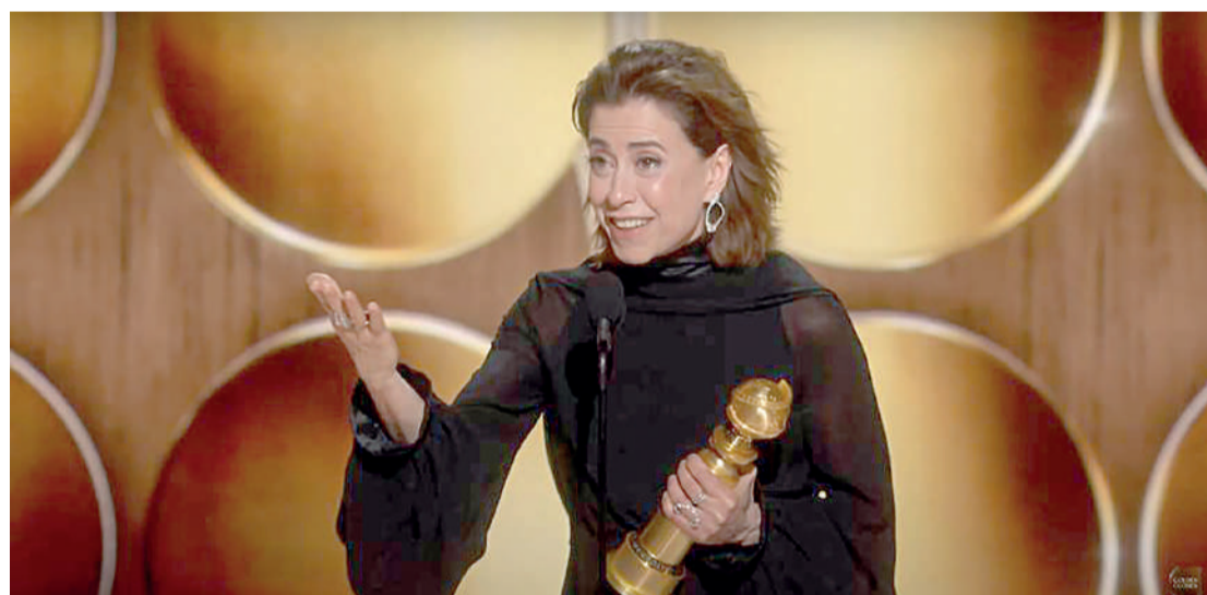
Fernanda Torres discursou e agradeceu à sua mãe, Fernanda Montenegro.

A ATRIZ BRASILEIRA FEZ HISTÓRIA AO SER A PRIMEIRA BRASILEIRA A VENCER O PRÊMIO NESTA CATEGORIA NA HISTÓRIA DA CERIMÔNIA