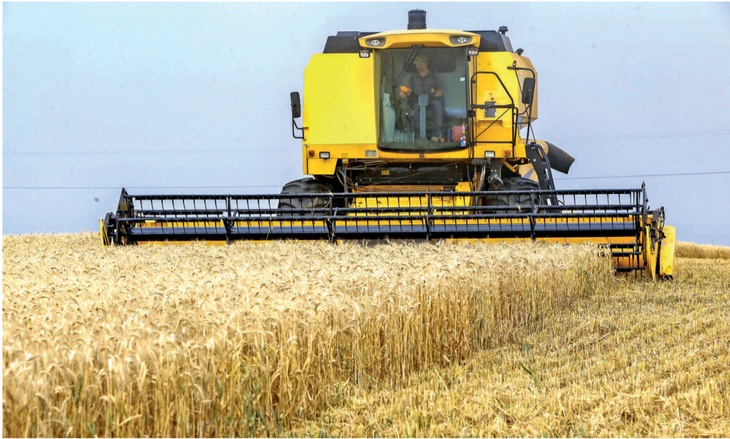
Até 19 de dezembro do ano passado, R$ 882 milhões já estavam comprometidos com a subvenção ao prêmio do seguro rural

O Programa de Seguro Rural sempre contou com a subvenção do governo, atendendo a contratação pelo produtor, em que o prêmio pago a ele conta com um subsídio na ordem de 40%, a depender da cultura. Diante do