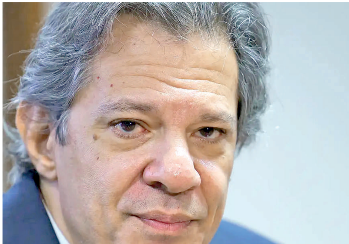
Haddad negou a possibilidade de o governo federal elevar o Imposto sobre Operações Financeiras ABR

país inicia o ano sem Orçamento aprovado. O Artigo 69 da Lei de Diretrizes Orçamentárias (LDO) de 2025, aprovada antes do receso parlamentar e sancionada no último dia 30, determina que a execução se dará conforme o Projeto de Lei Orçamentária Anual (PLOA), enviado ao Congresso em agosto. Nesses casos, os gastos devem ser executados na proporção de 1/12 por mês, até que o Orçamento seja aprovado.