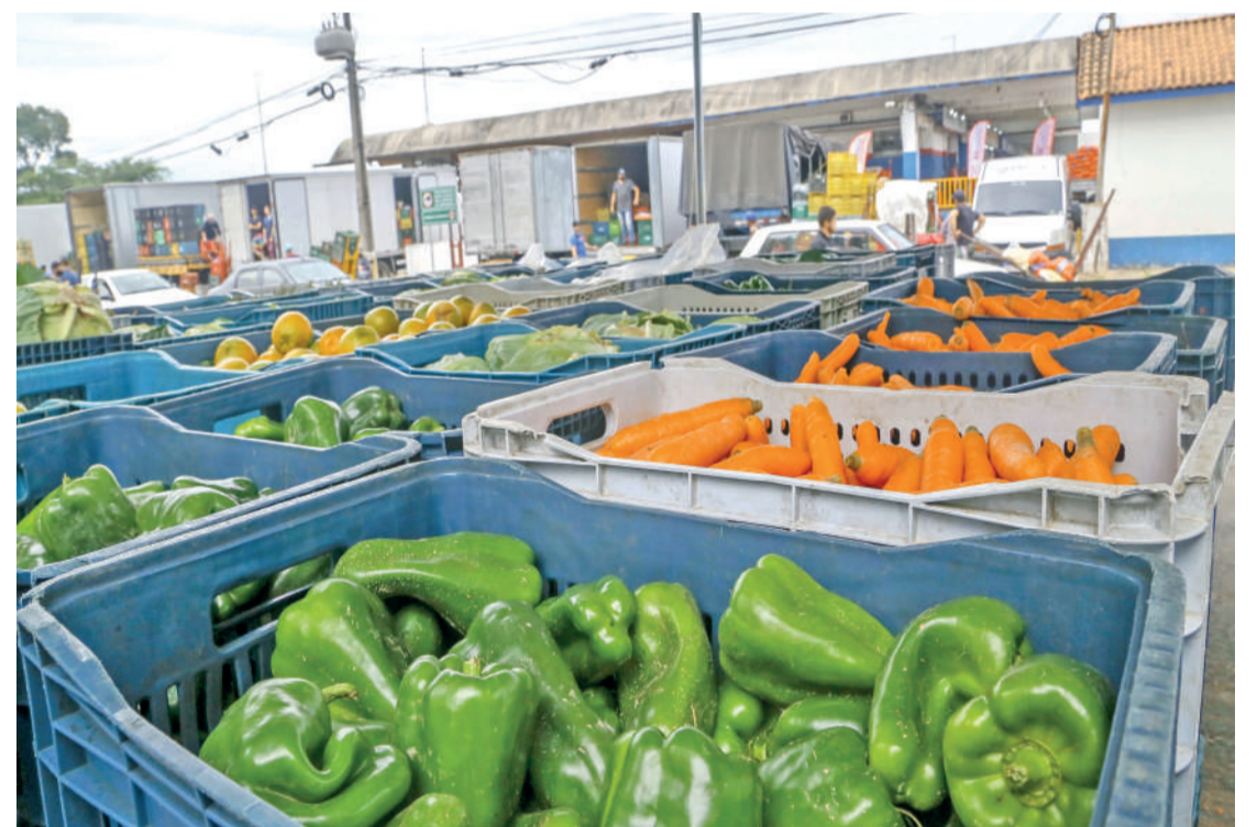
Há um conjunto de ações ocorrendo há alguns anos no Paraná que levou a esse resultado

Para ele, há um conjunto de ações ocorrendo há alguns anos no Paraná que levou a esse resultado. Entre eles a organização da Câmara Interministerial de