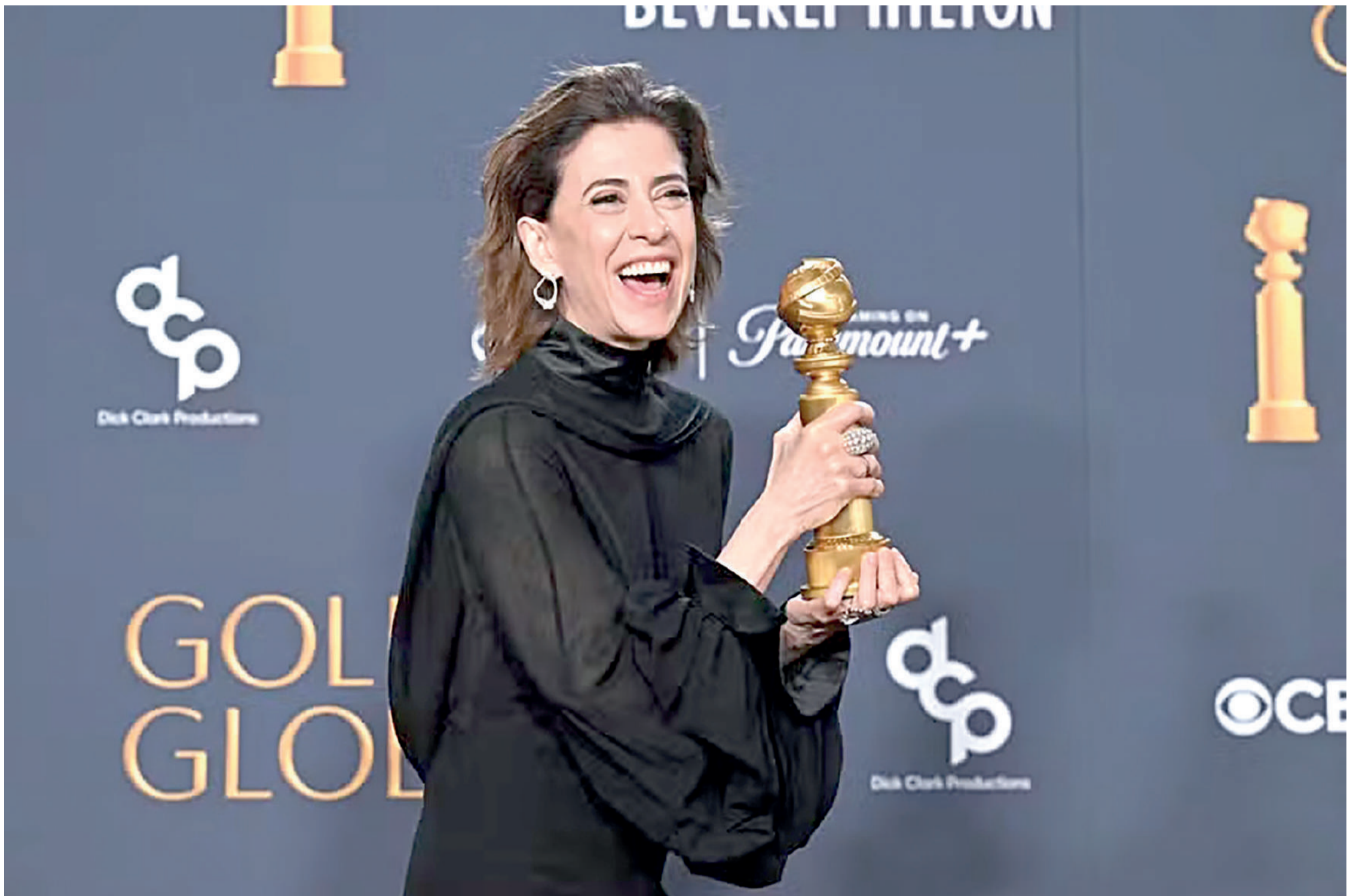
A atriz Fernanda Torres posa com o troféu de Melhor Atriz no Globo de Ouro 2025.

Ao receber o prêmio , Fernanda Torres se mostrou surpresa ao ter seu nome chamado ao palco como vencedora de Melhor Atriz em Filme de Drama