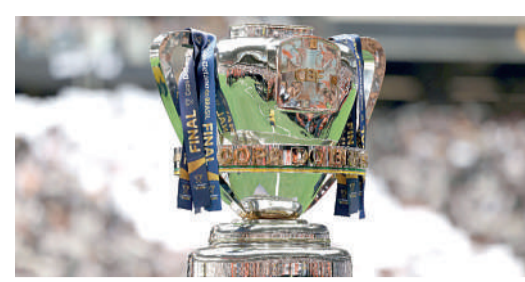
COPA DO BRASIL

E o Londrina será o primeiro adversário do Cascavel no primeiro jogo em casa neste Estadual. As duas equipes vão se enfrentar no dia 16 de janeiro, no Olímpico, pela segunda rodada.