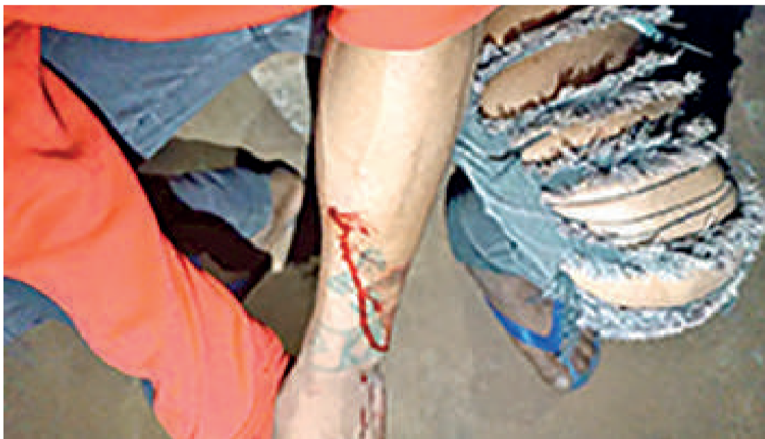
Quatro indígenas foram atacados a tiros por pistoleiros

•A comunidade avá-guarani residente na Terra Indígena (TI) Tekoha Guasu Guavira, situada entre Guaíra e Terra Roxa, no Oeste do Paraná, foi novamente alvo de ataques violentos. Quatro pessoas ficaram feridas e precisaram ser levadas para atendimento no Hospital Bom Jesus, em Toledo, distante cerca de 100 quilômetros do local. Os atos de violência ocorreram na noite da última sexta-feira (3). A Polícia Federal confirmou a ocorrência através de uma nota, informando que equipes de