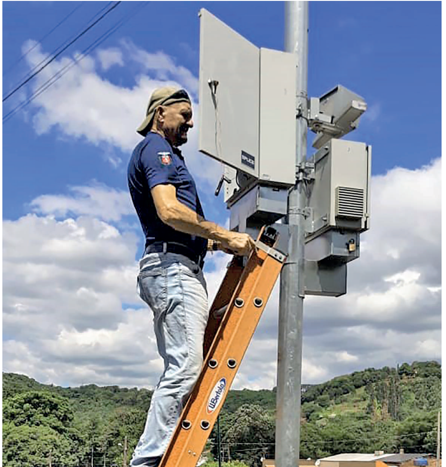
Radares estáticos são proibidos em rodovias estaduais do Paraná

“É vedada a participação de empresas privadas no produto da arrecadação de multas registradas por excesso de velocidade nas estradas estaduais, inclusive as concessionárias” LEI 12.826/1999