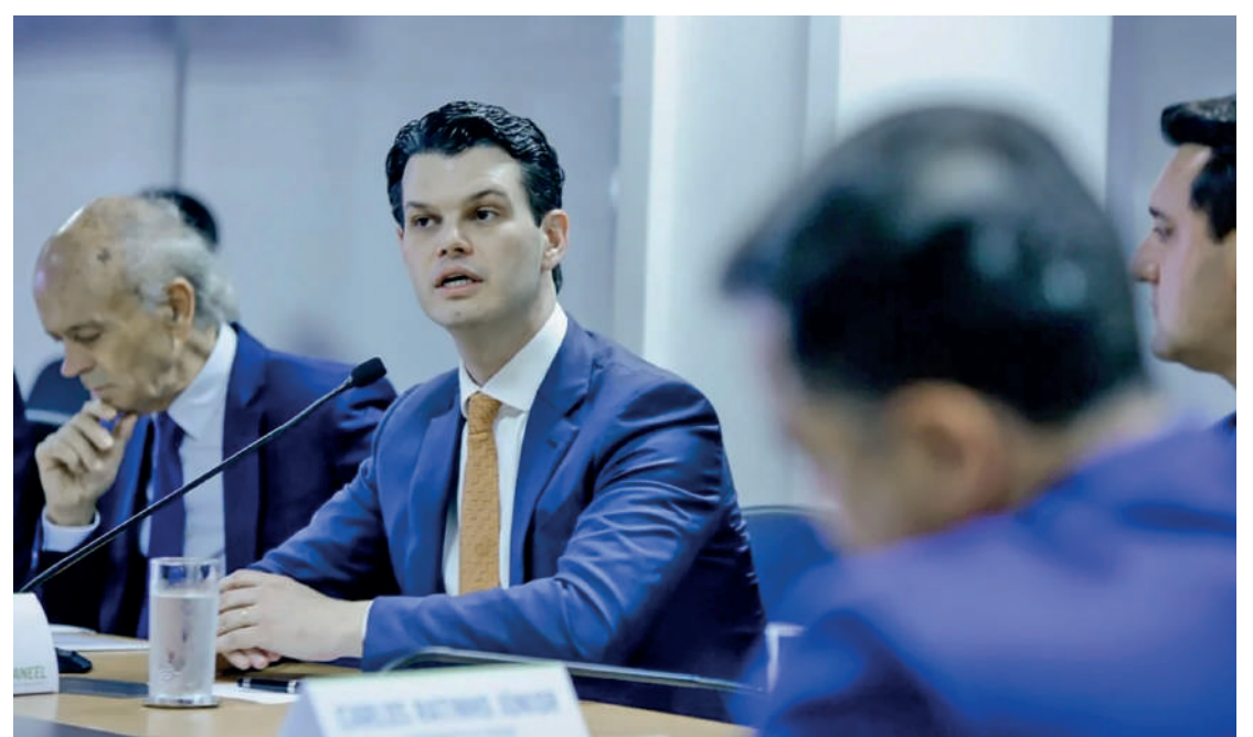
O presidente da Copel, Daniel Pimentel

Contudo, o tom positivo direcionado ao mercado não se refletiu na relação com os empregados. Antes da assembleia que deliberou sobre o acordo coletivo, a Copel enviou um comunicado informando que, caso a proposta fosse recusada, não haveria mais garantia de prorrogação da carta da data-base. O documento afirmava que os benefícios do acordo coletivo de