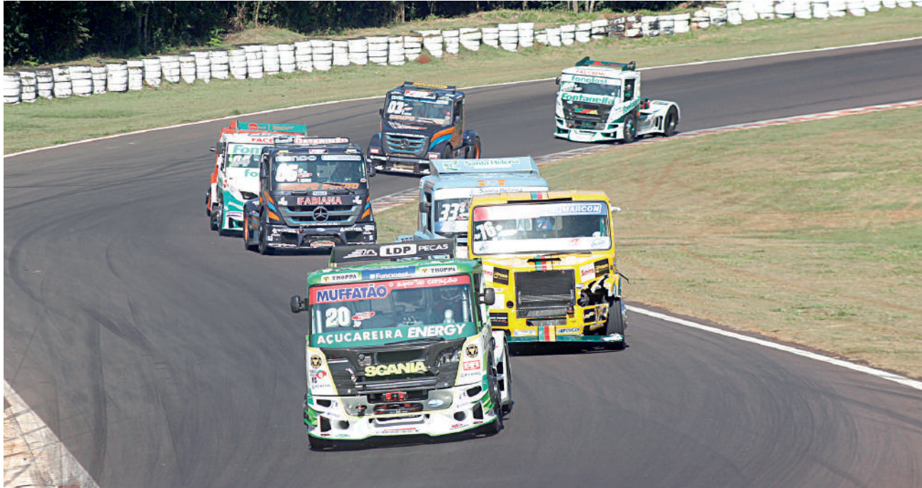
A última corrida do calendário da Truck será no domingo, em Cascavel