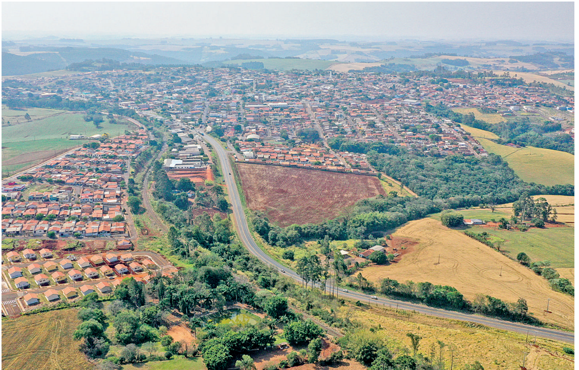
Vale do Ivaí receberá grandes obras com nova concessão

O município de Califórnia vai ganhar um contorno rodoviário paralelo à BR-376, com 5 quilômetros e 460 metros de extensão, todo em pista dupla