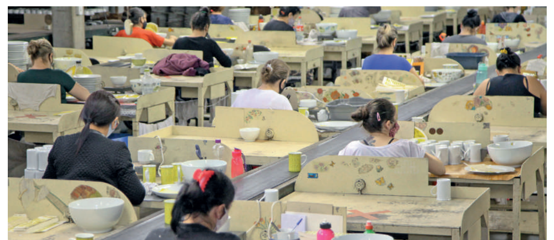
No total, 331 municípios registraram mais contratações do que demissões no ano

Números divulgados Caged mostram que Cascavel criou, de janeiro a outubro, 5.748 vagas de emprego formal , ou seja, com carteira assinada